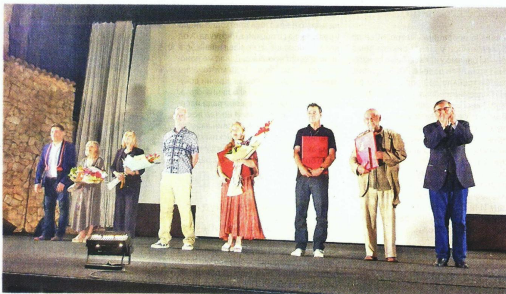
Наклон пред публиком: добитници признања