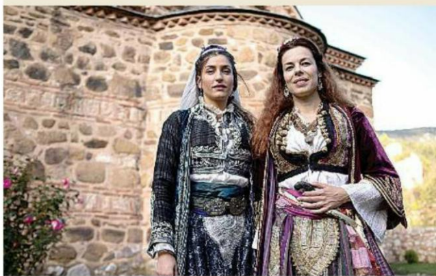
ОЧЕКИВАЊА Сцена из филма "Нечиста крв - грех предака" Милутина Петровића

ПРЕМИЈЕРА српског филма "Нечиста крв - грех предака"