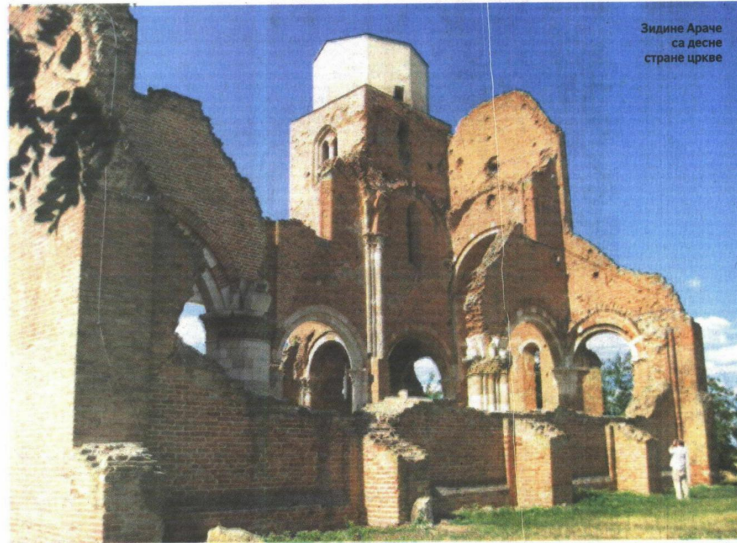
Зидине Араче са десне стране цркве