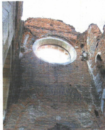
На горњем делу зида где је улаз је украс розета