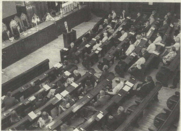
Novi saziv Skupštine Grada: Potvrđeni mandati 67 odbornika

- Dve stotine i četrdeset prvi rođendan našeg grada ove godine obeležavamo u nesvakidašnjim okolnostima, ali uz iskrenu zahvalnost lekarima i medicinskom osoblju, koji tokom epidemije korona virusa svakodnevno rizikuju živote i bore se za sve nas. Epidemiološka situacija je još uvek nesigurna, neophodna je disciplina u poštovanju preventivnih mera, razumevanje, strpljenje i odgovornost da savladamo i ovu opasnost, da nakon toga, uz podršku predsednika Aleksandra Vučića, Vlade Srbije i Pokrajinske vlade, nastavimo da ulažemo energiju u ekonomski oporavak našeg grada i njegov dalji napredak i razvoj - naglašava Bakić.