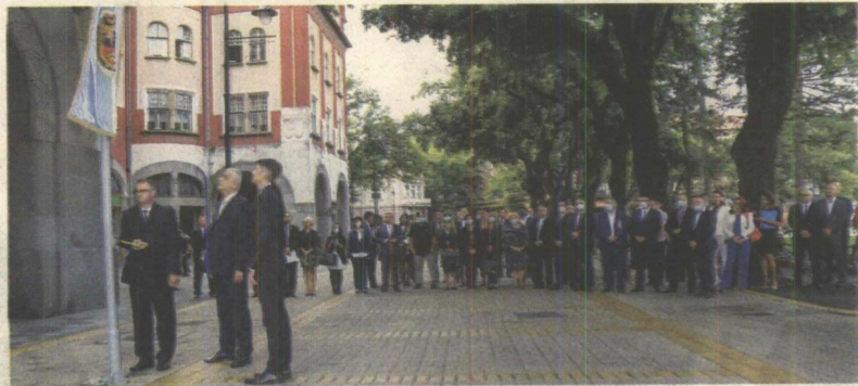
Podizanjem gradske zastave obeležen Dan grada

— Izvesno je, da će se gradska vlast u narednom periodu posvetiti, pre svega, realizaciji započetih, ali i novih projekata, tako da će aktivnosti biti usmerene na završetak radova na zgradi Narodnog pozorišta, nastavak izgradnje spa centra