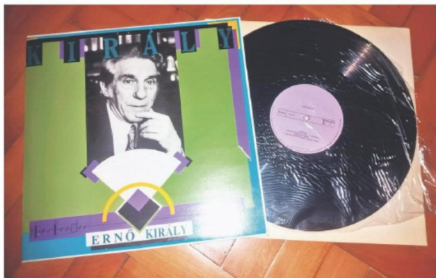
У композиторовој дискографији је двадесетак плоча

Мање је, међутим, познато да је Кираљ писао и поезију. Аутор је, по властитом признању, сто-