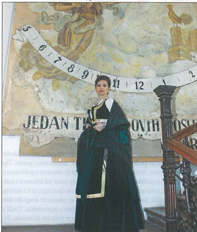
Bunjevka pod izvornim Sunačnim satom u somborskom Gradskom muzeju

nom uredu, zajedno sa okolnim prostorom pece „U lancima”, koji se prostiro s južne strane zdanja. Upravo je na ovom, najstarijem dilu starog baroknog samostanskog zdanja, polovinom 19. vika načinjen sunčani sat, koji i danas, posli skoro 170 godina, još uvijek postoji i savršeno „radi”. Imo je u to vrijeme Sombor mehaničke javne časovnike na crkvenim tornjovima (najstariji taki časovnik nalazio se na starom crkvenom tornju somborske Svetoduždvevske crkve, podignutom još četrdeseti godina 18. vika), ko i na tek podignutom tornju priuredene Gradske kuće el Magistrata, al sunčanog sata, do ovog vrimenta, barem po zapisanim tragovima, u gradu nije bilo.