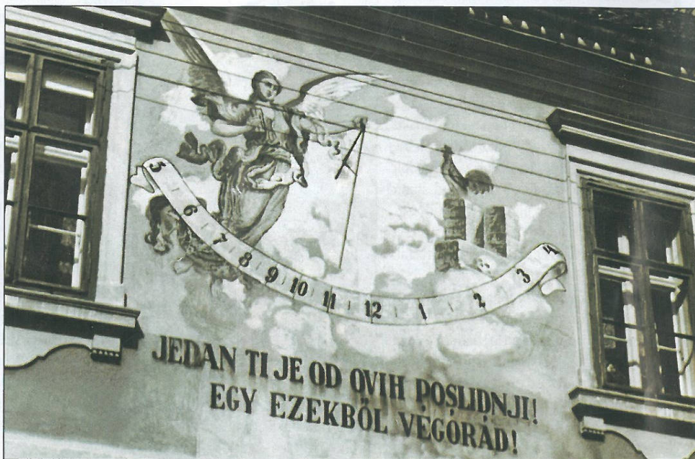
Sunačni sat početkom 20. vika sa natpisom na bunjevačkom

Nakon što su iz ovog zdanja iseljeni somborski franjevci, ono je služilo ko administrativno sidište Bačko-bodroške županije, sve do svršetka izgradnje nove županijske zgrade u Somboru 1808. godine, posli čega je, naredbom austrijskog cara Franca I, kadgodašnje zdanje franjevačkog samostana pridato somborskom rimo-katoličkom Žup-