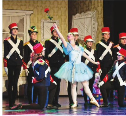
„Kositreni vojnik“ iz Siska

„Kristalna kocka vedrine“ iz Siska. U pitanju je moderan balet, u čijem centru je bajka. Pokret, snaga, disciplina, šarenilo i raskoš kostima i scene na najbolji mogući način je prihvatila bečejska publika i žiri koji je predstavu dodelio „zlatnog paža“.