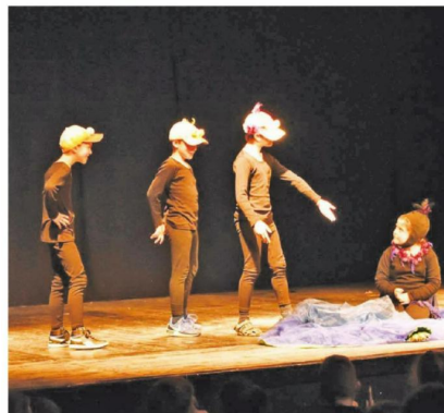
Bečejsko „Ružno pače“