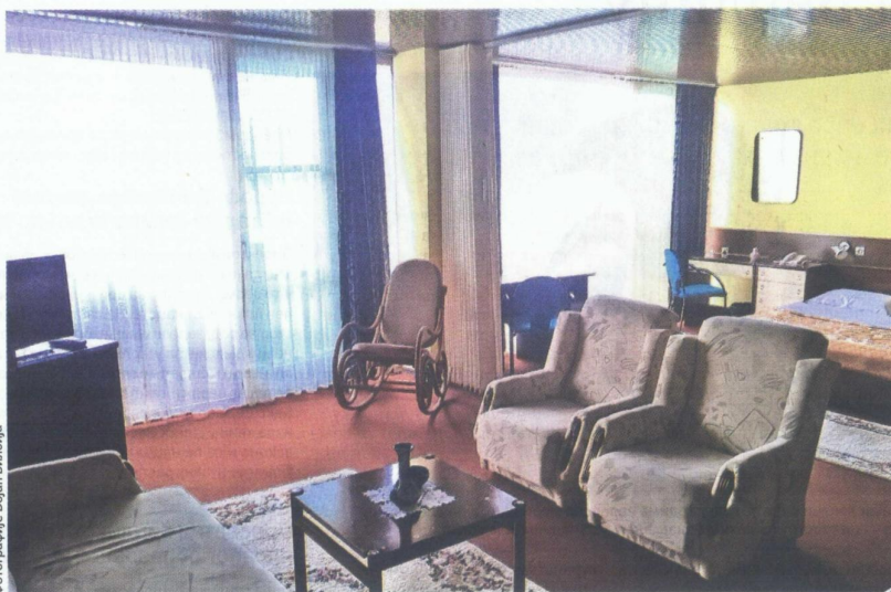
Апартман у коме је боравио славни велемајстор

– Код нас је дошао да се лечи, одмори и да буде у азиљу. За њим је била расписана потерница у Америци, због меча у Југославији којим је прекршио пореска правила и санкције против наше земље. Осим тога, он је, иако Јеврејин, био је изразити анти-