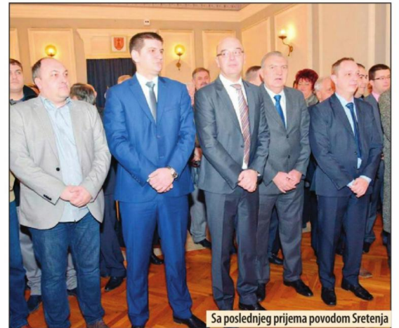
Sa poslednjeg prijema povodom Sretnjaca