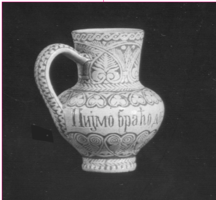
Kis boroskancsó. A XX. század eleje. Teodor Branovački és Klauz Pál készítette. Zenta. E 296. MVf. 35404.

Az itteni piacokat, vásárokat helybeli magyar gölöncsérek látták el köcsöggel, bögrével, korsóval, fazékkal, tállal . A mindennapos használati edényekből készítették a legtöbbet. Díszítésükben az egyszerűség, a visszafogott-