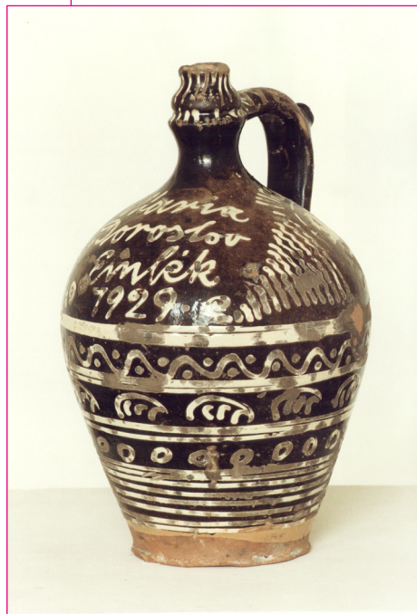
Doroszlói butkoskorsó. 1929. Zenta. Fotó: Szénási Oszkár, 1999.

formák és díszítési eljárások, mint pl. a folytatott angób-díszítés 2 hatottak talán leginkább a vajdasági népi kerámiára. A XVIII. század végén és a XIX. század elején évente négyszázezer korsót hoztak Mohácsról folyami úton, a Dunán, de a Dráva és a Száva menti falvakba is jutott a feketekerámiából. A XX. század elején polgári hatásra megjelennek az új edényformák, a díszkerámiák, amelyek gyakran a gyári porcelánt utánozva főként a lakás díszéül, illetve ajándék-