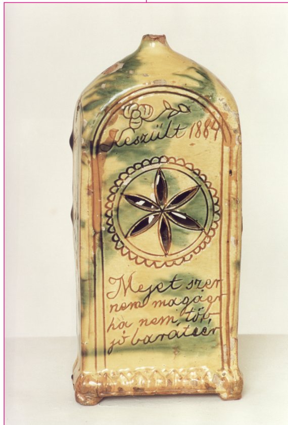
Butella. 1884. A horgosi Varbai Jenő plébános gyűjtése. EV 43.