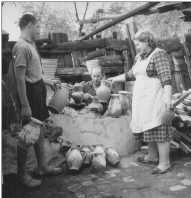
Berakodás az étetőkemencébe. Zenta. VMf 668. Fotó: Pethő István, 1954.

Kisebb műhelyek működtek Magyarkanizsán, Martonoson, Zentán és Óbecsén is. Mestereik általában mindennapi használat-