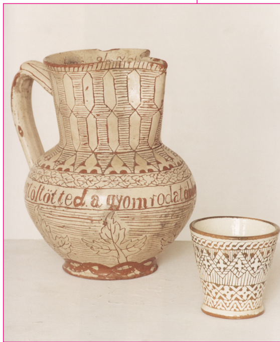
Borospohár és kancsó. A XIX–XX. századforduló. Zenta. Ltsz. 286. E 504.