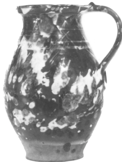
Köcsög. 1930, Zenta. E 520. fMV. 35401. Fotó: Papp Júlia, 1980.