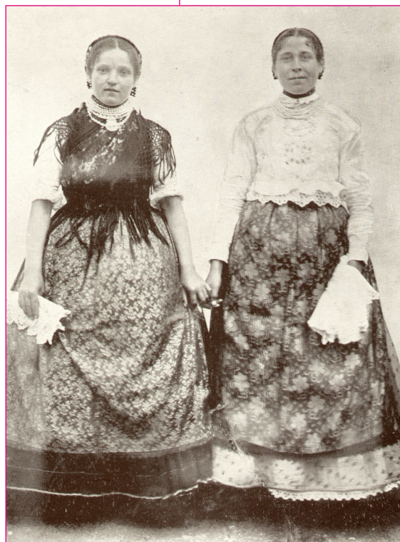
Lányok ünneplőben. Borovszky: Magyarország vármegyei, Bács-Bodrogh II.