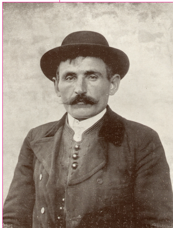
Asszonyviselet és férfiviselet. Ada. Borovszky: Magyarország vármegyéi, Bács-Bodrogh II.