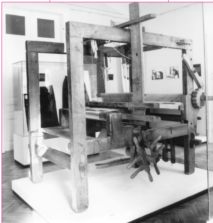
Takácsszövőszék. Fotó: Stevan Kragujević, 1985.

Kiállításunkon takácsszövőszék látható „kenderre felvetve”,