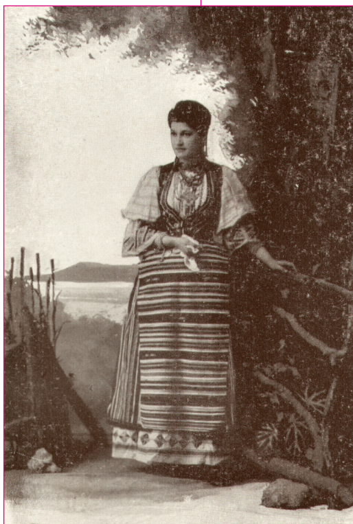
Szerb lány szőtt kötényben. XX. század eleje, Zenta.