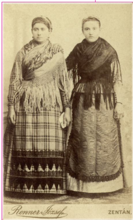
Leányviselet az 1900-as évek elején, Zenta. Archív fotó: Renner József, é. n.

A női viselet mindig igyekezett a divat hatását követni. A magyar asszony ünnepi alsóöltözetéhez tartozott a fehér ing, a pendely, a slingelt alsószoknyák.