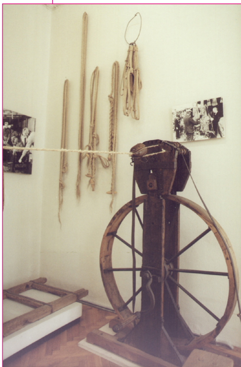
Fonókerék. Balla István használta 1960-ig. Zenta. Fotó: Gergely József, 2003.

E kiállításrész hiteles felújításához, a kötelesműhely minél teljesebb bemutatásához az írásos forrásanyag mellett a Zentán élő mesterek, valamint családtagjaik szóbeli közlése is sokban hozzájárult. A kötelesmesterek Apatinban, illetve Hódságon kapták meg mesterlevelüket. A mesterek felsorolásakor a zentai Történelmi Levéltár kézműiparosokról szóló iratállományára hivatkozunk. 1 Iparengedélyt vál-