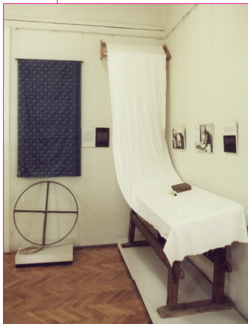
A kétfestéshez szükséges ráf és tarkázóasztal mintadúccal. Kiállításrészlet.

A kutatások igazolják, hogy a XVIII. században már 21 településen működött a Bácskában kétfestőműhely, közöttük: Csonoplyán, Bezdánban, Monostorszegegen, Apatinban, Szivácon, Hódságon, Kulán stb. 3 Szegeden 1844-ben összesen harminc kétfestő (3 mester, 21 legény és 6 inas) dolgozott. A Tisza menti részeket és a Bánságot sokáig a szegedi kétfestők látták el portékával. 4 Katona Pál és Újházi Erzsébet 5 is gyűjtöttek erre vonatkozó adatokat.