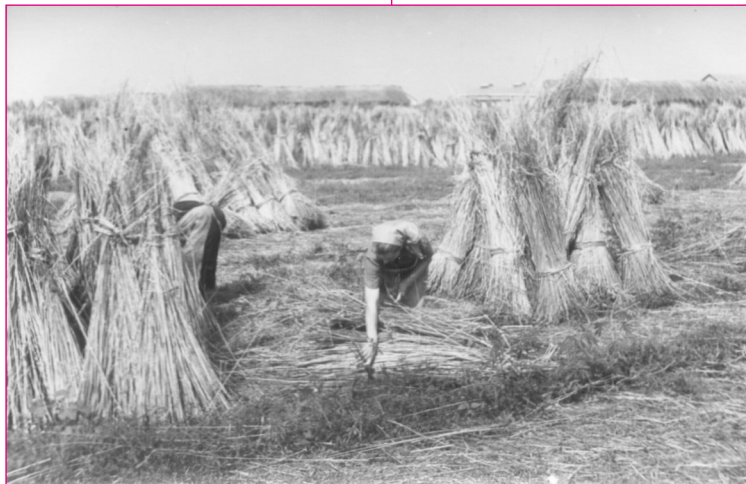
A kender kévébe rakása. Zenta. VMf. 985. Fotó: Pethő István, 1955.

A kentert kézzel vetették, mint a gabonát. Amikor a növény színe zöldről sárgára változott, kinyűtték. Ahol nagyobb területen termesztették, ott kendervágó kiskaszával vágták le. Ezután került sor a feldolgozásra: először