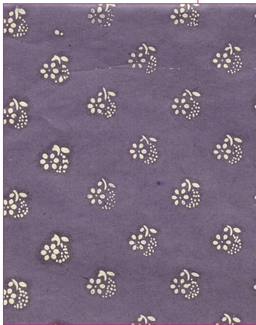
Kedvelt virágos kékfestőmintá. 1890-es évek. Zenta. E 1184.

színnyomó perrotine-géppel volt felszerelve. A kékfestők többnyire gyári vászonnal, „molinóval” és „kalikóval” dolgoztak, de a házi vásznat is megfestették. A kelmét festés előtt a tarkázóasztalon mintázták négyszegletes „ mintázódúcok ” segítségével, majd „ kerekrafra ” erősítve indigófestékebe eresztették. Amikor a kellő sötét színt elérte, megfelelő töménységű savas vízben kimosták. Ekkor a tarkázáskor felvitt fedőfesték kioldódott, és a minta fehérén maradt. Ezután a keményítés és mángorlás következett.