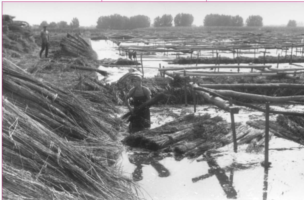
Kenderáztatás. Zenta. VMf. 979. Fotó: Pethő István, 1955.

A XVIII–XIX. században az önálló kötélgyártó céhek a ken-dertermelő központok közelében,