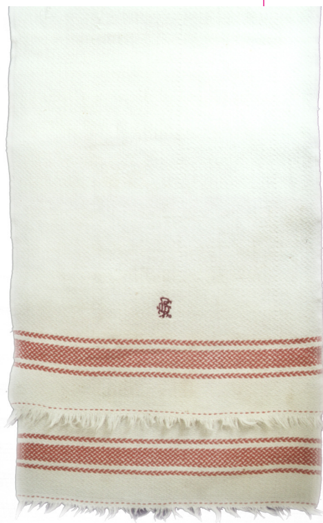
Dísz törülköző. XX. század közepe, Zenta.

Népünk öltözködésének sokszínűségét a századfordulón ké-