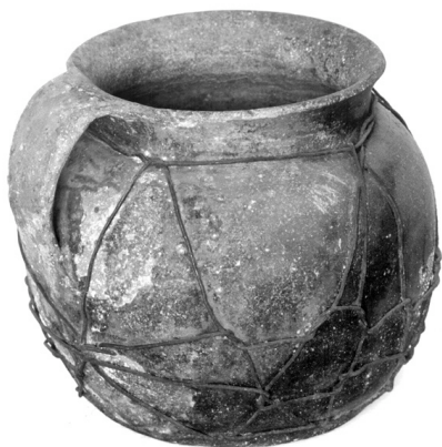
Főzőfazék. XIX. század vége. Magyarkanizsa. sz. n.

lötté a ruhatartó rúdon lógott köznapokon a felleveő ruha. A szobát a második világháború végéig csak fehérrel meszelték. Az iparosok Zentán már a múlt század húszas éveiben kipingálták lakásaikat. Régen mázolt föld volt a padlózat. A deszkapadló a második világháború után kez-