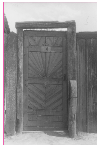
Kiskapu Ladányi László há- zán. Adorján. VMf. 1344. Fotó: Pethő István, 1957.