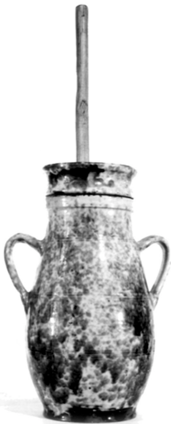
Köpülő. 1935. Magyarkanizsa-Tóthfalu. E 72.8.3. fMV. 35414. Fotó: Papp Júlia, 1980.

kén. A XX. század elején a színes bútorokat háttérbe szorították a barnára festett polgárius bútorok. A mezővárosi paraszti szobabelsőben is megjelent a flóde-rozott, faragott és esztergályozott részekkel díszített fiókos sublót, komód, az ajtóval nyíló sifonér és a szekrény. A század végére a