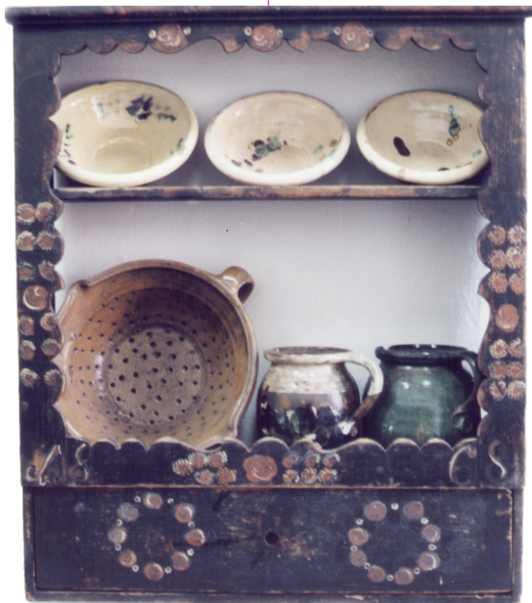
Festett tálás (tányérok). 1868, Zenta. E 466. Fotó: Gergely József, 2003.