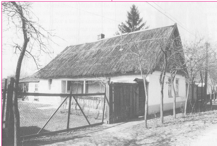
Nádfedeles parasztház. Felsőhegy. Fotó: Révész Róbert, 1999.

A deszkaberakás variációival, a padláslyukak különböző formáival, sokféle homlokzati díszítéssel találkozunk.