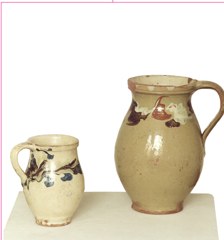
Köcsögök. XX. század közepe. Zenta. E 625. E 1519 Fotó: Szénási Oszkár, 1999.