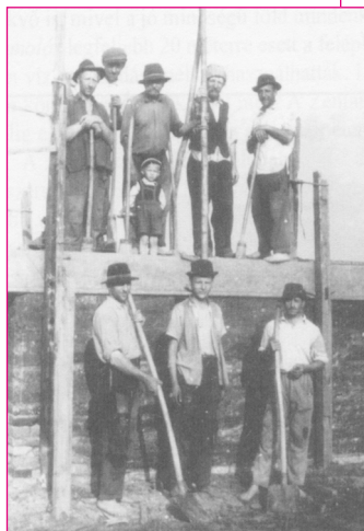
Falverők. Zenta. Amatőr fotó, 1967.