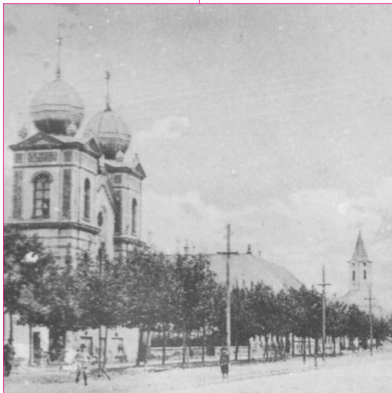
Utcarészlet a zsinagógával. Ada. XX. század eleje. VMf. 5687.

Az 1797-ben készült első zentai birtokkönyv már erős vagyoni differenciálódást tükröz. Az 1800-ból való harmadik adománylevél a vagyonos rétegek érdekeinek megfelelően szabályozta a kerület közigazgatási és vagyoni jogi helyzetét. Ettől kezdve az új betelepődőket nem illet-