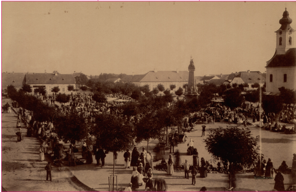
Főtér piaccal. 1890-es évek. Zenta. VMf. sz. n.

A megfogyatkozott lakosságot a kamara 1750–60 táján új te-