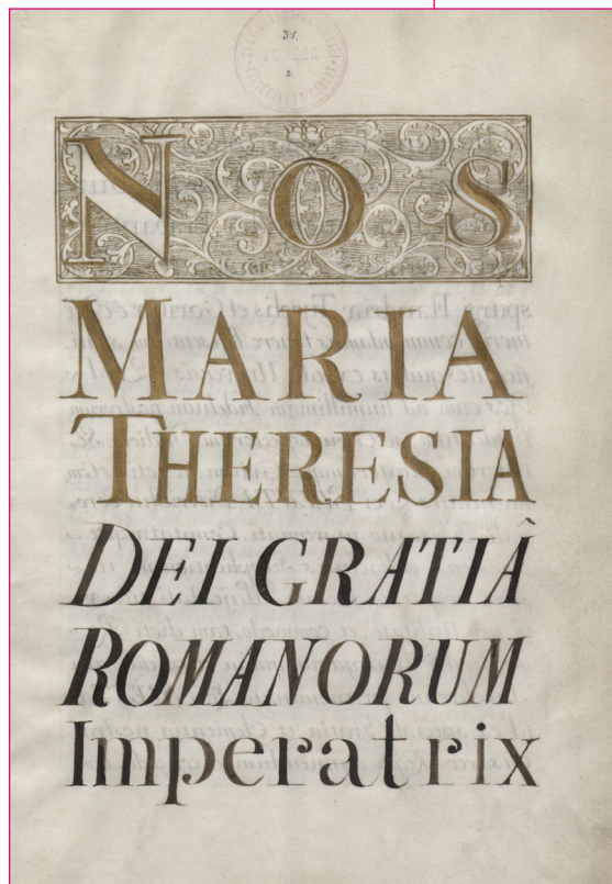
Mária Terézia kiváltságlevele Zentának, amely vásár- és piactartásra jogosítja fel a várost. 1751. ZTLf. 001.4.

muk állandó növekedést mutat. A kezdetleges kézműipar főleg az állattenyésztés és növénytermesztés nyersanyagát feldolgozó iparnak kedvez, köztük a század végén fellendülő malomiparnak (vízimalmok).