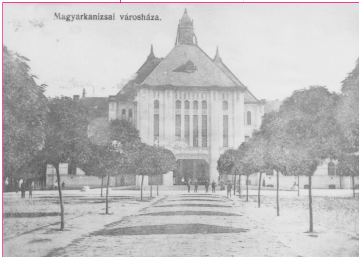
Magyararkanizsai városháza. XX. század eleje. VMf. 5689.

Az iparosság letelepítésére nagy gondot fordított a bécsi udvar. A letelepedő iparosok ingyen kaptak telket, a házépítésre pedig kölcsönt és építőanyagot.