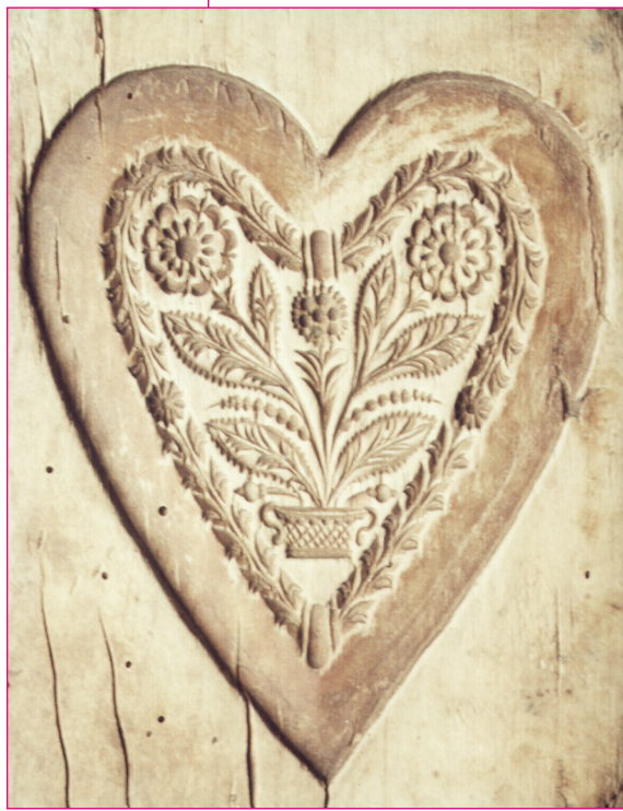
Mézeskalácsforma – szív. XX. század eleje. Horgos. EV 356. Fotó: Gergely József, 2003.