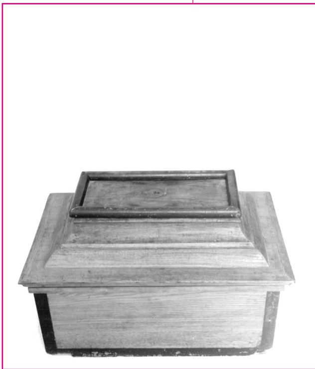
Céhláda. 1815, Zenta. Fotó: Gergely József, 2003.

céhrendszer kereteinek tágítására azonban csak az 1848-as forradalom eredményeként került sor. A céhek feloszlása után feladataikat az ipartestületek vették át. A takácsok, szűcsök, csizmadiák, szabók, asztalosok, lakatosok, kovácsok, kerékgyártók, kötélgyártók a vásárokon értékesítették termékeiket. Zentán a múlt század végéig harmincféle mesterség virágzott. Sokáig működtek a fésűs- és mézeskalá-