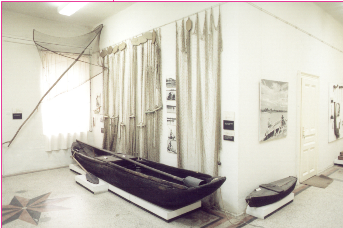
Halászat – a kiállítás részlete az 1989-es átrendezés után. Fotó: Gergely József, 2003.

Kívánjuk, hogy kiállításunk megtekintése alkalmával kedves látogatóinknak információkban gazdag, korszerű látványt nyújtó élményben legyen részük!