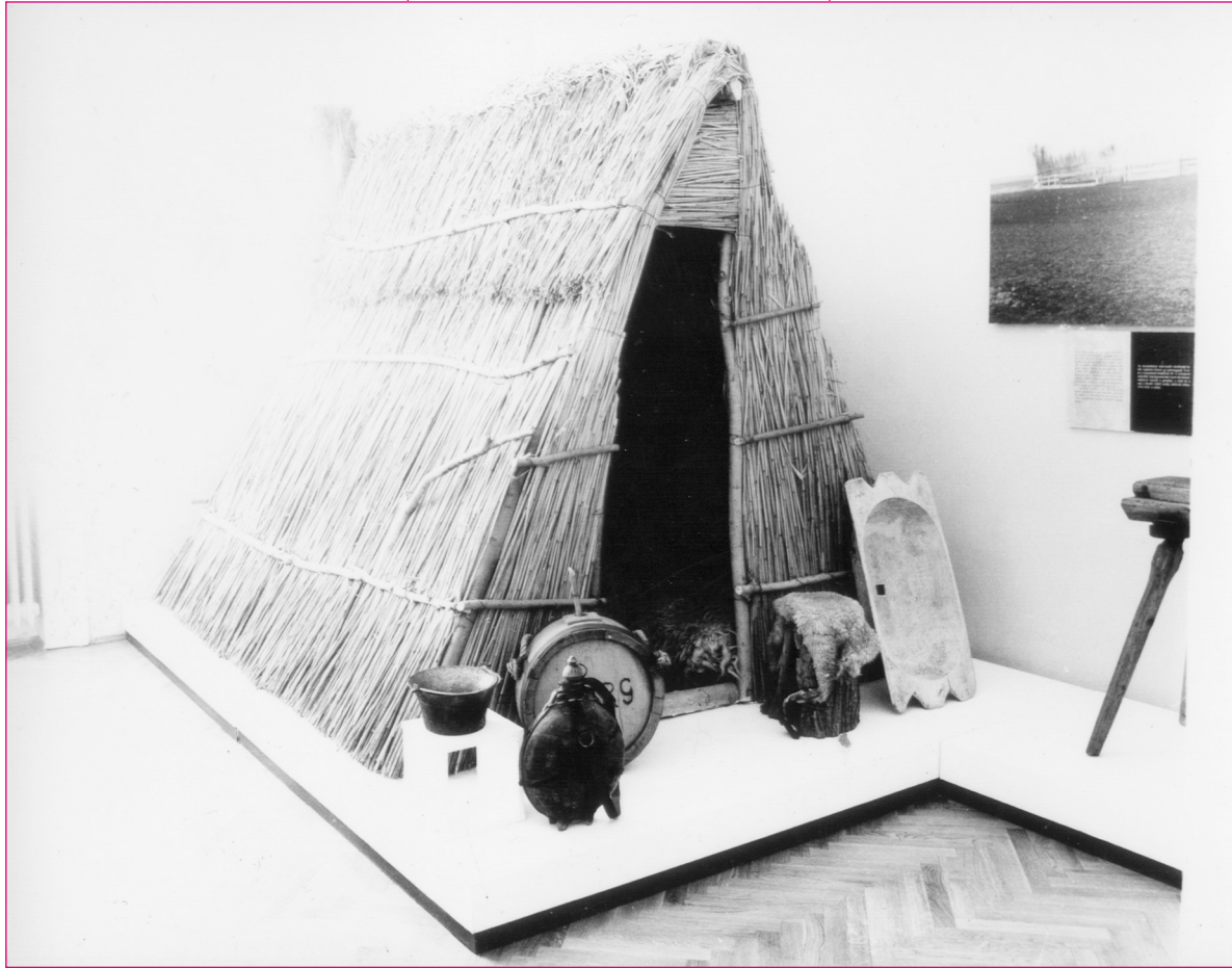
Pásztorélet – a néprajzi kiállítás részlete.

lításunkban is hangsúlyozni szeretnénk a Tisza jelentőségét, hiszen a folyónak korábban meghatározó szerepe volt e vidék életében. Az újonnan bemutatásra került tárgyak és képek nagy része a XX. század eleji mezőváros élet-