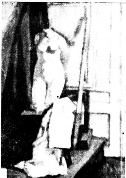
Acs József: „Csendélet” — olajfestmény