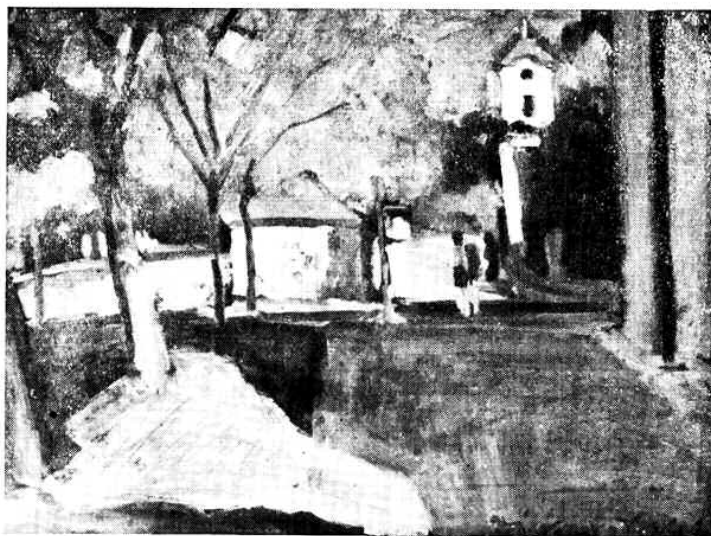
Diószegi Balázs: „II. Rákóczi F. utca Ujvidéken” — olajfestmény