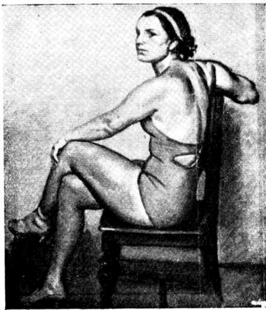
Oláh Sándor: „Fürdőruhács nő” — olajfestmény