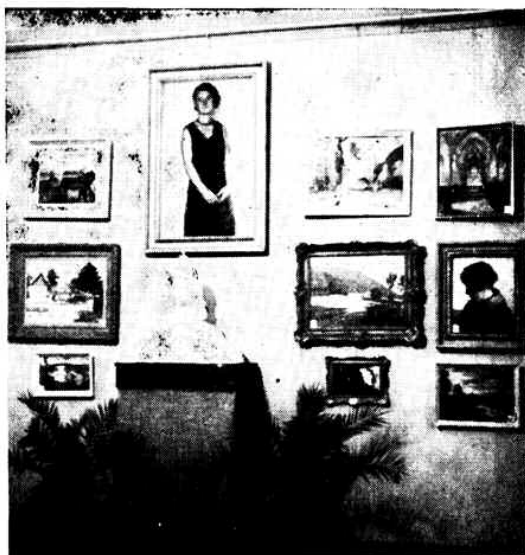
Részlet a „Délvidéki Szépműves Céh” kiállításáról