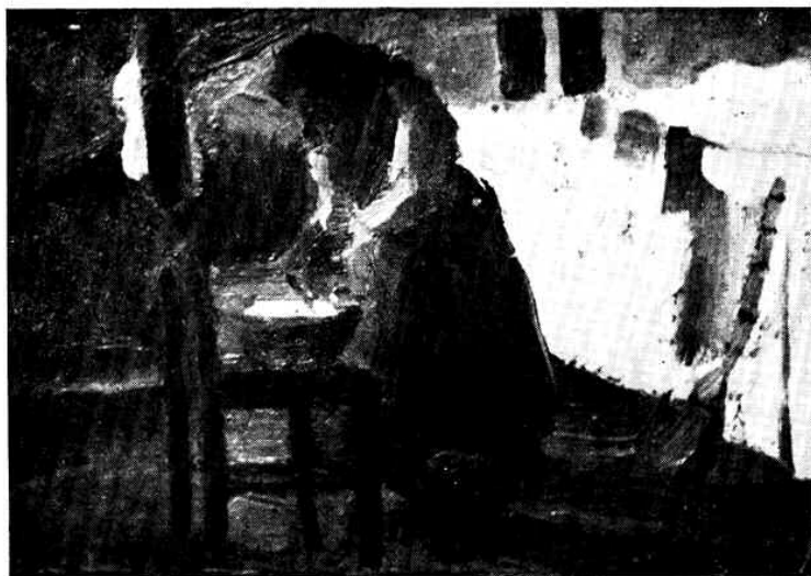
Hagyik István: „Mosó nő” — olajfestmény