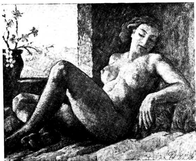
Gyermis Lukács: „Tavaszi” (akt. komp.) — olajfestmény Kiállítva: Mantova 1939 — Budapest 1941 — Ujvidék 1941