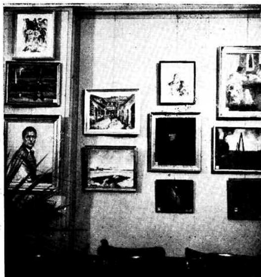
Részlet a „Délvidéki Szépműves Céh” kiállításáról