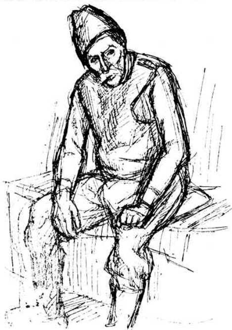
Erdey Sándor rajza

Ki tartja fenn a mesét? A közösség-e vagy a mesemondók? Mind a kettő: a közösség, amely érdeklődik iránta, szereti és meghallgatja, és a mesélő, akinek megvan az az istenadta képessége, hogy a hallott, másoktól tanult meséket élvezhető szép formában tudja elmondani. Hol talál-