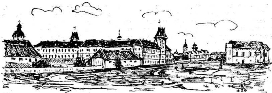
(Jakobsits János rajza)