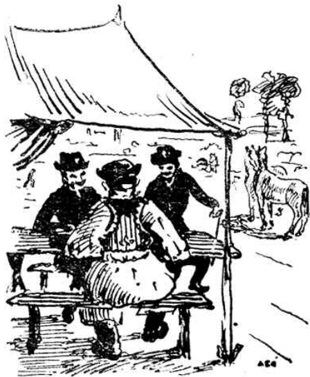
(Jakobsits János rajza)

Másnap este a jól sikerült kostoló már javában folyt. Éppen a vacsorához telepedett már a társaság és mennybéli parfümök illata kezdett szétfelhőzni a körülhordott óriási tálak tartalmából.