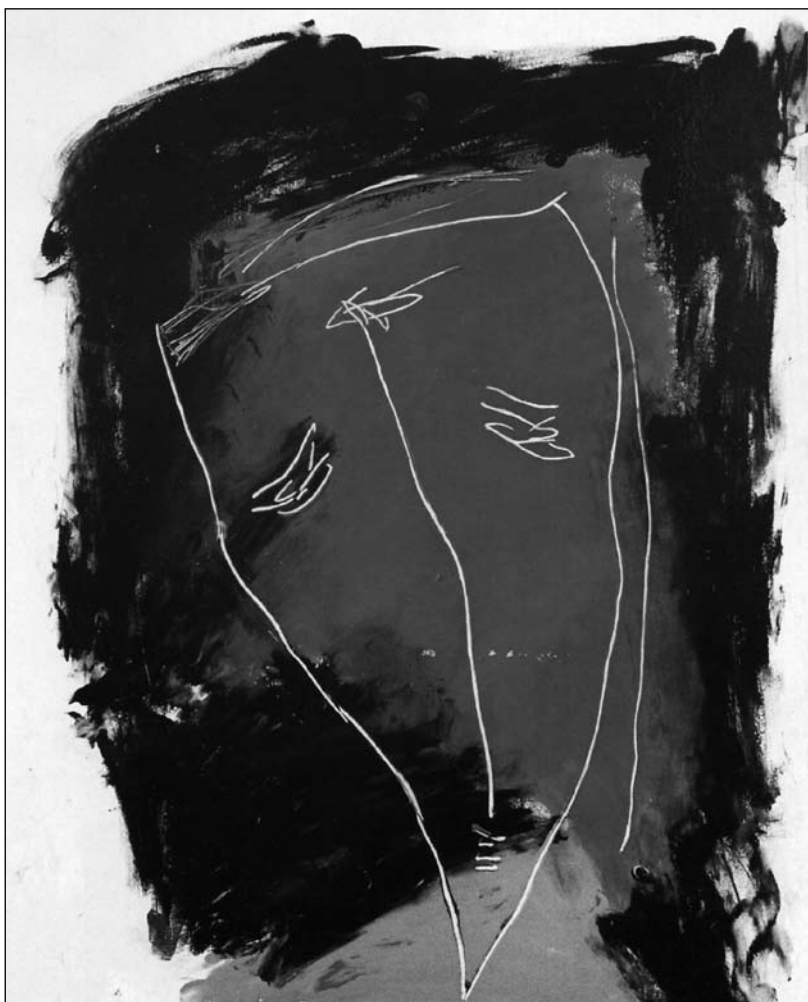
Lainović: Krisztus-fej (részlet)

témák (Krisztus, Szűzanya gyermekével) és a templomi architektúra motívumai... Az ősidők ilyen felismerése – nyilvánvalóan – a végehez való közeledéshez méltó, azokhoz a pillanatokhoz, amikor a valódi alkotóknál az addig felgyülemlett tapasztalat magvas megnyilatkozásokká szublimálódik. Éppen ezért Cvetko Lainovićnak ezek a képei, rajzai a szellem és a képzőművészeti gondolat szabadságának végső felismerését hordozzák magukban. És éppen ezért, ezek a művész utolsó ciklusából származó darabok a vonalról, a rajzról, a képről és a festészetéről alkotott felfogásának logikus crescendóját jelentik; crescendót, amelyben egy külön poétika bontakozik ki, egy különleges és nagyon személyes „felkarcolt” vonalnyom, amelyet a festő és művész Cvetko Lainović hagyott maga után.