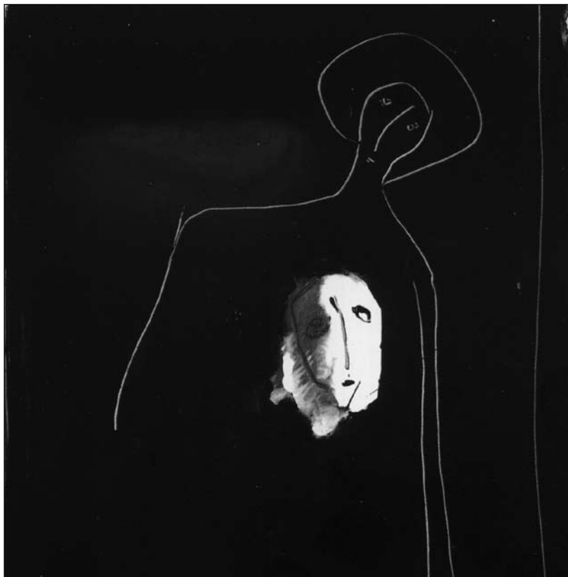
Lainović: Bánat (részlet)

felett az ormó, ha a vándor hirtelen alája lép, hogy elébe álltam, oly hatalmasnak tűnt. Na jó, maradj, szólalt meg végre, miközben a lámpát eloltotta, és a készülő rajzot egy üres lappal letakarta. S tréfálkozni támadott kedve, és miután előttem térdet hajtott meghorgadva, akár a színházban úrnője előtt a szolgál, hosszú dikcióba fogva ismertette ceruza és papír és festék és százféle művészkellék jelentőségét, egyet-egyet felemelve közülük mondta, csak mondta, csak mondta, s e tárgyakat táncoltatta, akár sátrában a bábos a kócfigurákat szokta, és én akkor e játéktól bátorítva sebtén felfedtem azt a rajzot, akár rétről ha csusszantja folyóba a havat a nap hirtelen sugara, és láttam a rajzon őt: arca megnyúlt s elkomorult, és megfehérlett haj és kiderült szakáll és bajusz keretezte, de a szem, minek eleven fénye évtizedek múlva arcomat oly sokszor bejárta, nevetve kutatta a léttelen lét sűrülő homályát. – Ne, ezt ne, kiáltotta, majd meggondolta magát, és a képet szemem elé tartotta: – Ilyennek látsz majd akkor , a hidegágyon! – És jámborult haragja. – Jól van, ne bőgj – folytatta szinte suttogva –, készítsd elő a lapokat! Nincs mivel rajzolnod? Itt ez a csonka ceruza!