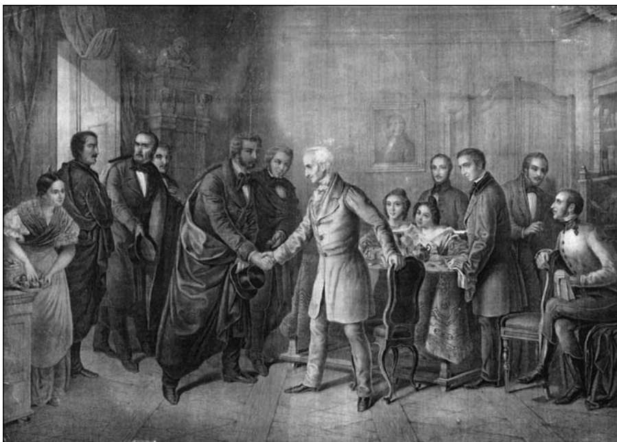
Orlai Petrich Soma: Kazinczy Ferenc és Kisfaludy Károly első találkozások

– annál is inkább, mert ezúttal mindez nem kizárólag metaforikus megfogalmazás, hiszen Orlai Petrich képe valóban őrzi Toldy ifjúkori arcvonásait is. A nemzedéki elv érvényesítése ezért is tartalmaz oly gyakran – akár csak rejtve is – emancipatórikus szándékokat. Vagy azért, mert az értelmezendő irodalomtörténeti események eleve valami ilyesféle tartalmú generációs önértelmezést is tartalmaznak, s az interpretátor ehhez igazodik, vagy kifejezetten az irodalomtörténész alkotja meg a nemzedékek fogalmát. Az irodalomról és az irodalom társadalmi használatáról sokat elárul, ha megpróbáljuk megfigyelni, hogyan és miért.