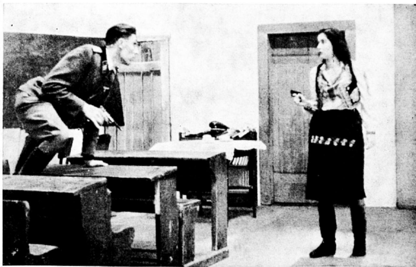
Balázs Béla: Boszorkánytánc, 1945.