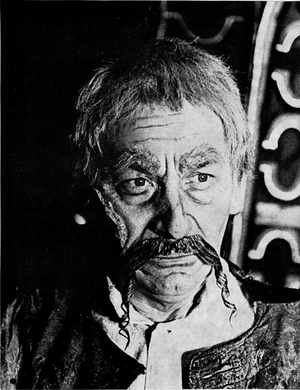
Katona József: Bánk bán. 1968.