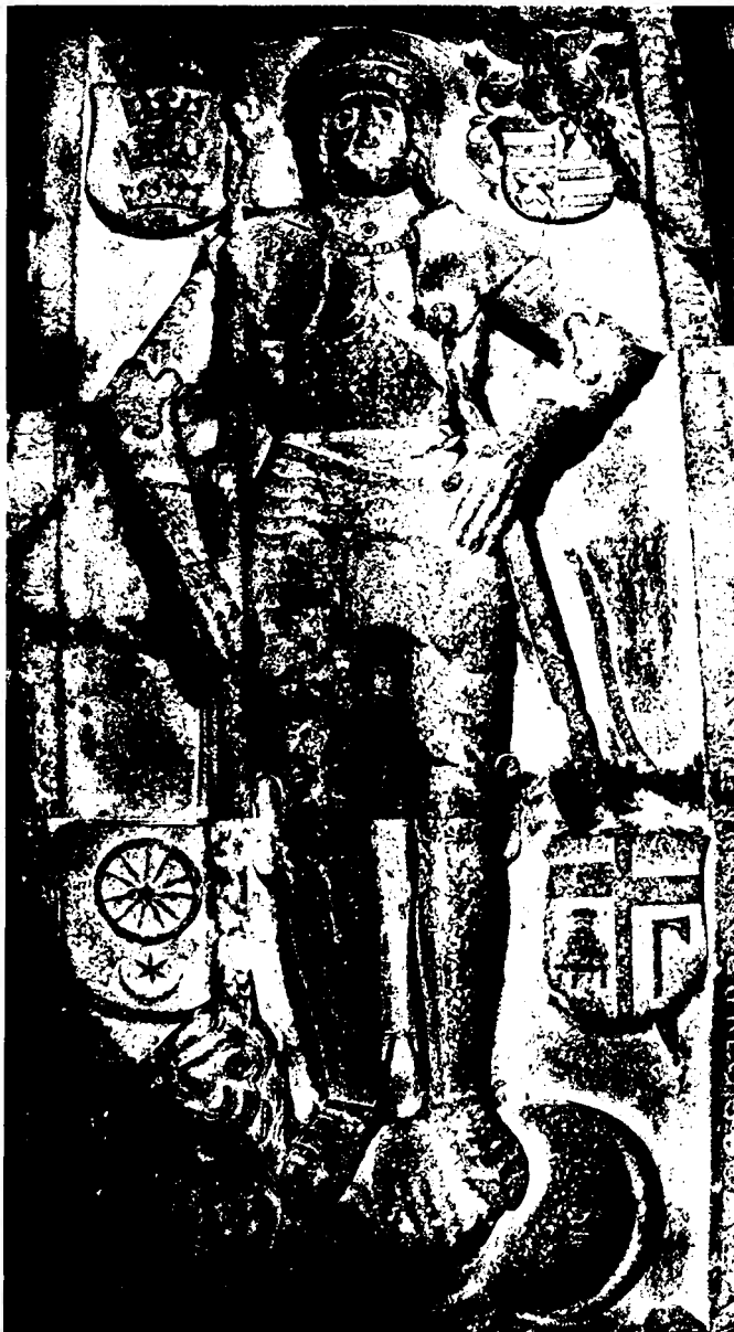
Ujlaki Lőrinc síremléke az iloki templomban