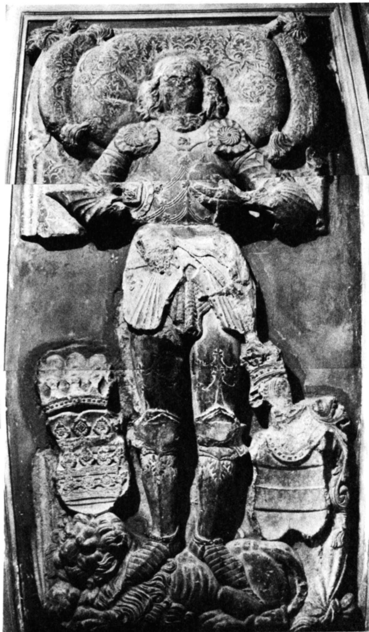
Ujlaki Miklós síremléke