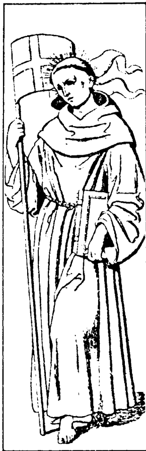
Kapisztrán János (Rafael rajza után)