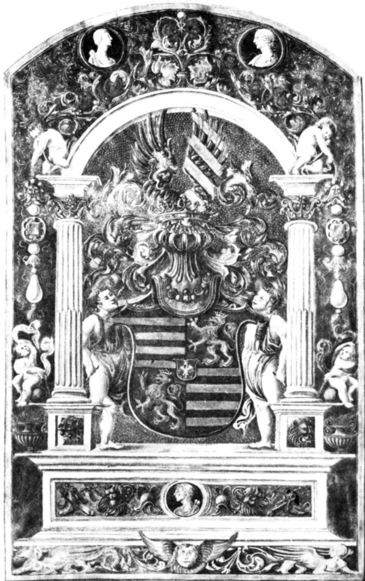
Az Ujlaki család címere