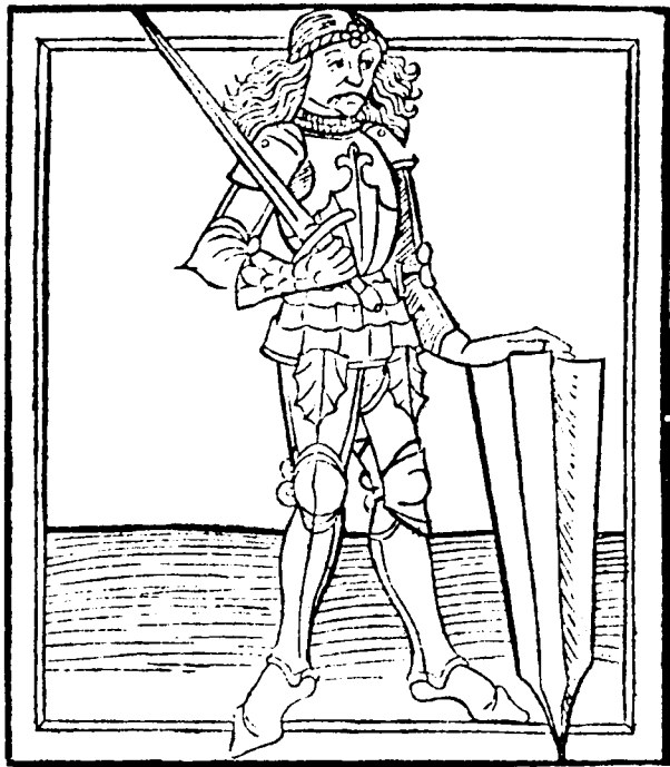
Hunyadi János (A Turóczy Krónikából)