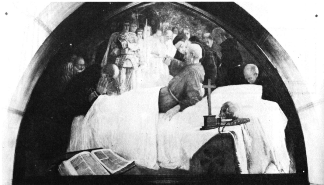
Kapisztrán János halála (Festmény az iloki ferences zárdában)