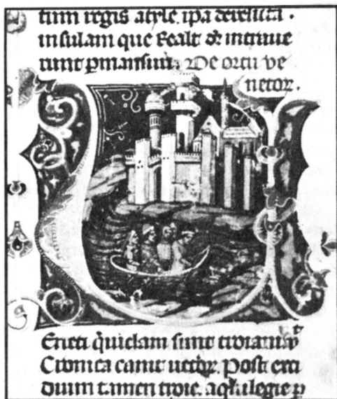
Aquileia lakosai csónakon menekülnek a városból. Miniatúra a Képes Krónikából.

Egy napon, midőn körüljárta a várost – sok varázsló volt vele, babonás hite miatt felette bízott bennük –, megpillantott egy gólyát, amint felszállt a tengerről egy palota tetejére, ahol fészke volt, csőrébe fogta fiókáját, és szemük láttára elvitte a tenger nádasába. Azután visszatért és fészkevel együtt a többi fiókát is átvitte.