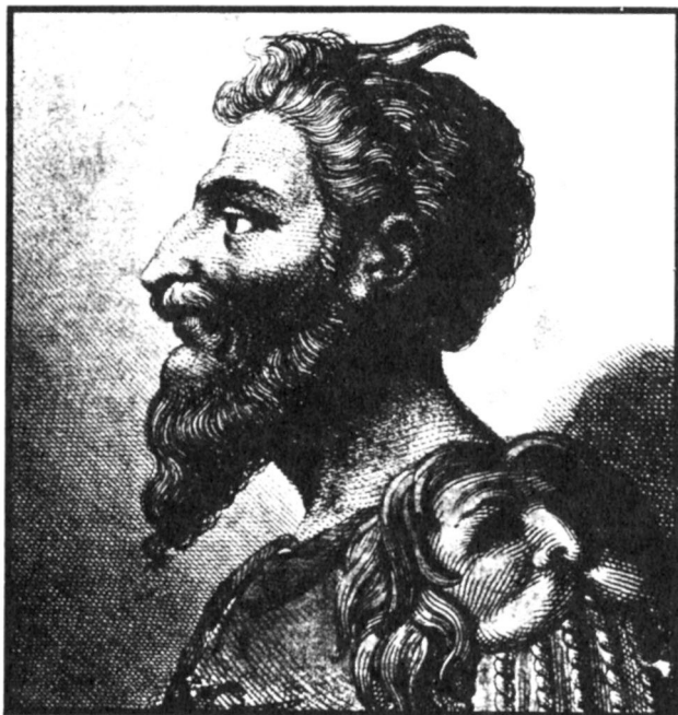
Attila, a fején szarvakkal. Olasz rézkarc a XVII. századból

tók is a hunokban vélték felfedezni a magyarok őseit. Erre a hagyományra támaszt találtak mind a nyugati mind a bizánci krónikákban, amelyeknek írói a VI. század végén érkező avarokra és a IX. század végén megjelenő magyarokra is ráillesztették a hun nevet. A Konstantinápolyt bevenni készülő avarok és az Európa-szerte kalandozó magyarok is a hunokra emlékeztették a régebben itt élő népeket.