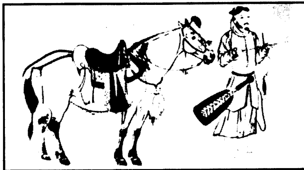
Nomád harcos lovával. Kínai ábrázolás

Amint a gyermek megüli az ürüt (herélt kos), nyilával madarakra és apró vadakra lövöldöz; a nagyobb gyermek nyulakra és rókákra vadászik, azoknak húsát elfogyasztja. Mindazok, akik az íjat már jól tudják kezelni, lovasosztatokba lépnek... (A lovat nem vasalták, nem ismerték a kengyelt, de kezdetől fogva használták a nyeret.) ... A mindennapi életben az állatállományról gondoskodnak és vadásznak, amiről el is tartják magukat. Szűkös helyzetben mindannyian fegyverforgatást gyakorolnak – rablóhadjáratra készülnek.”