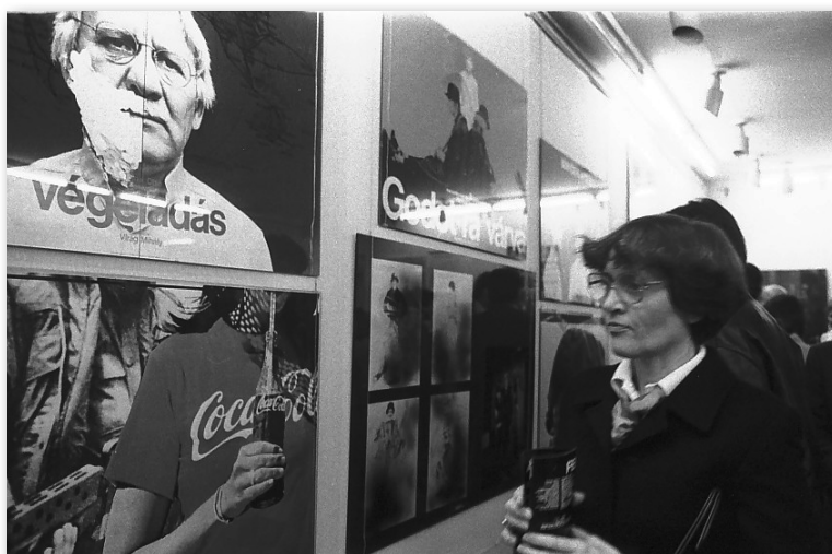
Baráth Ferenc plakátjai Újvidék főterén