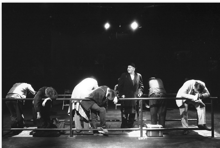
A buszmegálló (Fejes György)