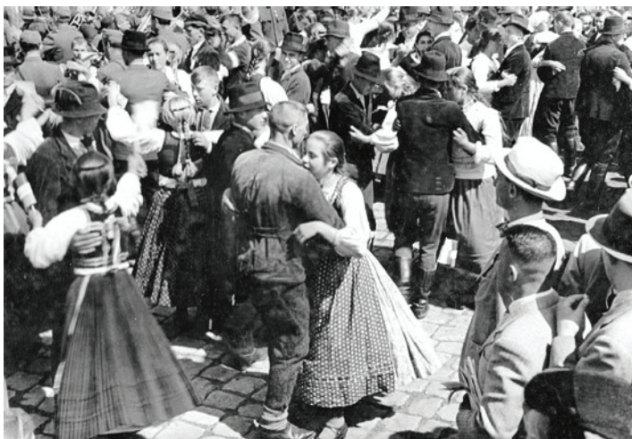
Andrásháza népe a harangszentelés és a hármaskeresztelő napján, 1942. július 17-én