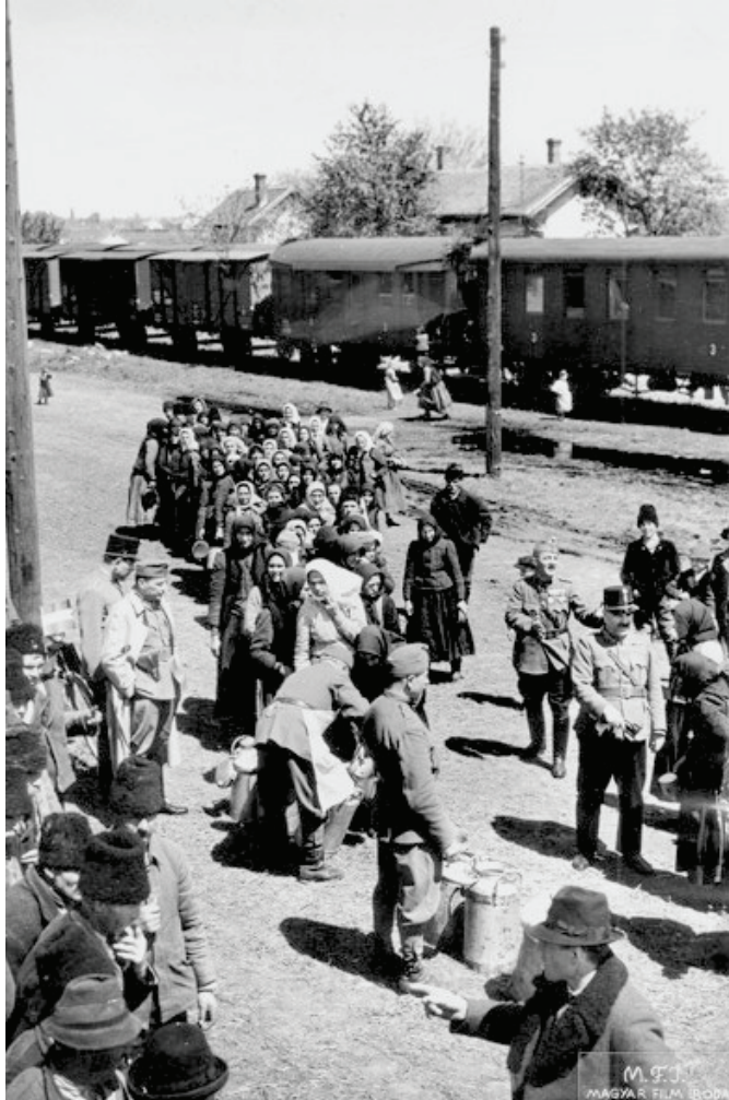
1941 májusában a kosnai határállomáson