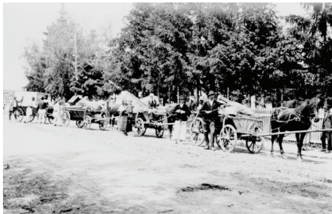
1941. június 3-án az andrásfalvi reformátusok is búcsút vettek falujuktól (Bognóczy Géza református lelkész felvétele)