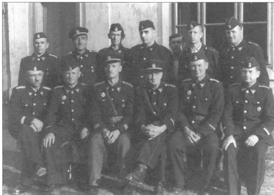
Az önkéntes tűzoltó egyesület vezetősége 1957-ben