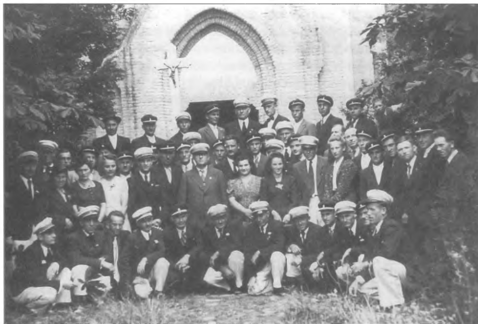
A budiszavai Dalárda és a Noviszádi Polgári Dalegylet közös hangversenye utáni felvétel 1940 júniusában – a római katolikus templom bejárata előtt