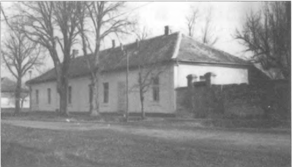
A Katolikus Kör épülete 1980 körül