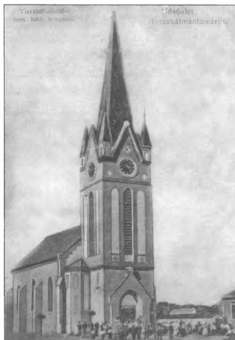
Az újonnan felépített római katolikus templom első képe 1909-ből. A Magyarok Nagyasszonya nevet vette föl