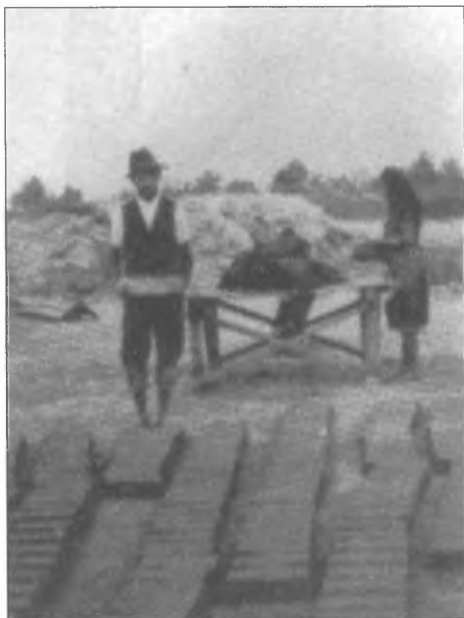
Vályogverés a falu telepítésének idején