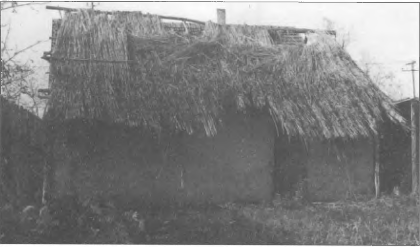
Az 1970–80-as évekre fennmaradt telepes házak