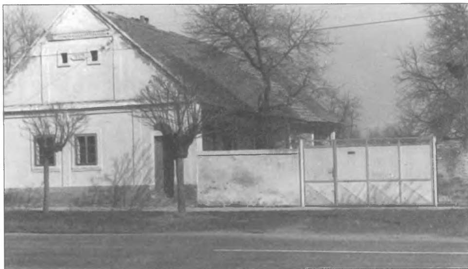
Telepes ház a főutcán