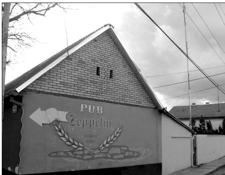
A Zeppelin Rádió épülete