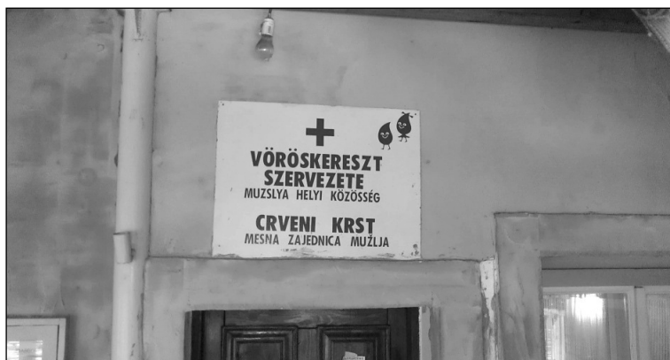
A Vöröskereszt bejárata

A Vöröskereszt helyi szervezete 1947-ben újraéledt, a helyi közösség tanácsában ténykedő szociális bizottsággal szorosan együttműködve fejtette ki tevékenységét. Az ezredfordulón 200 tagot számlált, és tíztagú vezetőség irányítja a szervezet munkáját, amely az önkéntes véradók összefogását, a vasárnap délelőtti vérnyomásmérést, az idős betegek látogatását, jótékonyági akciókat foglal magában, valamint a múlt század kilencvenes éveiben az ún. népkonyha működtetését. Minden év októberében megszervezték, megszervezik a Napsugaras őszi rendezvényt az idős polgárok tiszteletére. A helyi Petőfi Sándor MME otthonában alkalmi kultúrműsor keretében kedveskednek nekik. A mozgáskorlátozott időseket meglátogatják, és a helyi közösség tanácsának alkalmi ajándékát átadva próbálnak örömet szerezni nekik. Ilyen alkalmakkor a hátrányos szociális helyzetű családoknak alkalmi csomagot osztottak