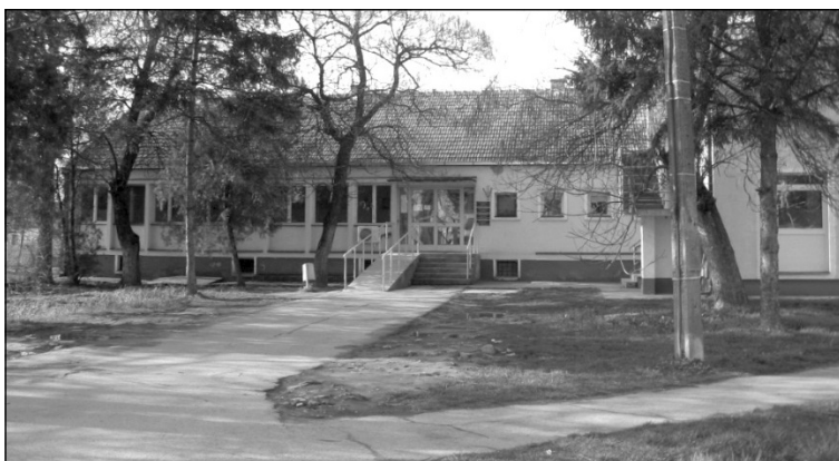
Az egészségház épülete

A nagybecskereki gyermekorvosi rendelőből Muzslyára hozták a diákok kartonjait, és ettől a naptól kezdve a muzslyai gyerekeket helyben kezeli a szakorvos (gyermekorvos). Ezzel a muzslyaiak régi vágya teljesült. Az épület ünnepélyes átadására 2006-ban került sor. Az anyagiakat a muzslyai helyi közösség és Nagybecskerek városa teremtette elő. A nagybecskereki Biro-54 tervezőiroda terve alapján az Eurodomus kivitelező vállalat építette fel 2006-ban. A helyi