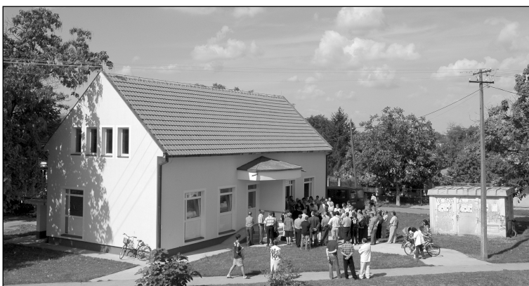
A gyermekorvosi rendelő