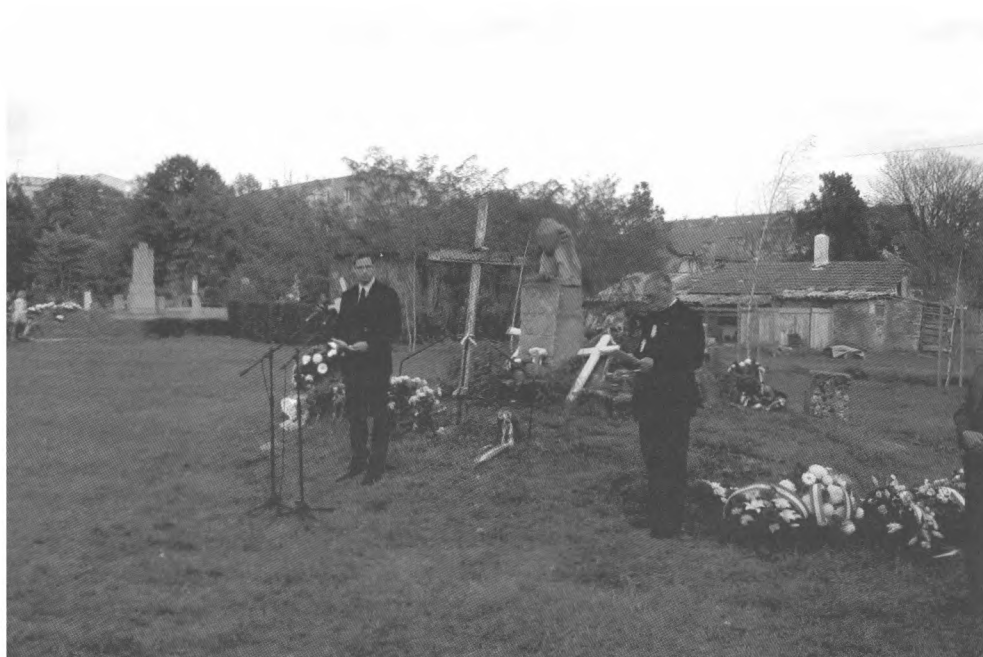
Dr. Gulyás Gergely emlékezett és koszorúzott a Futaki úti temetőben, 2013. november 2-án