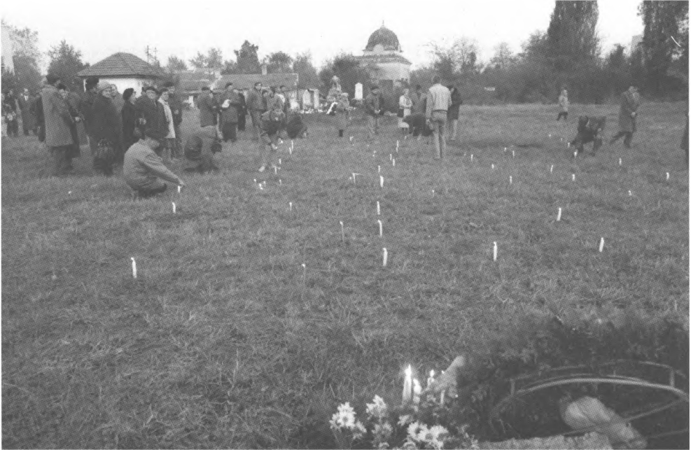
Gyertyagyújtás a száz kereszt helyén (1991)