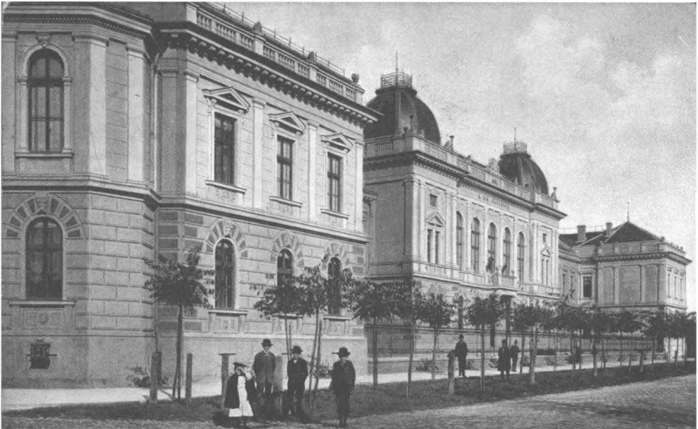
A Törvényszéki palota épülete, régi képeslapon.