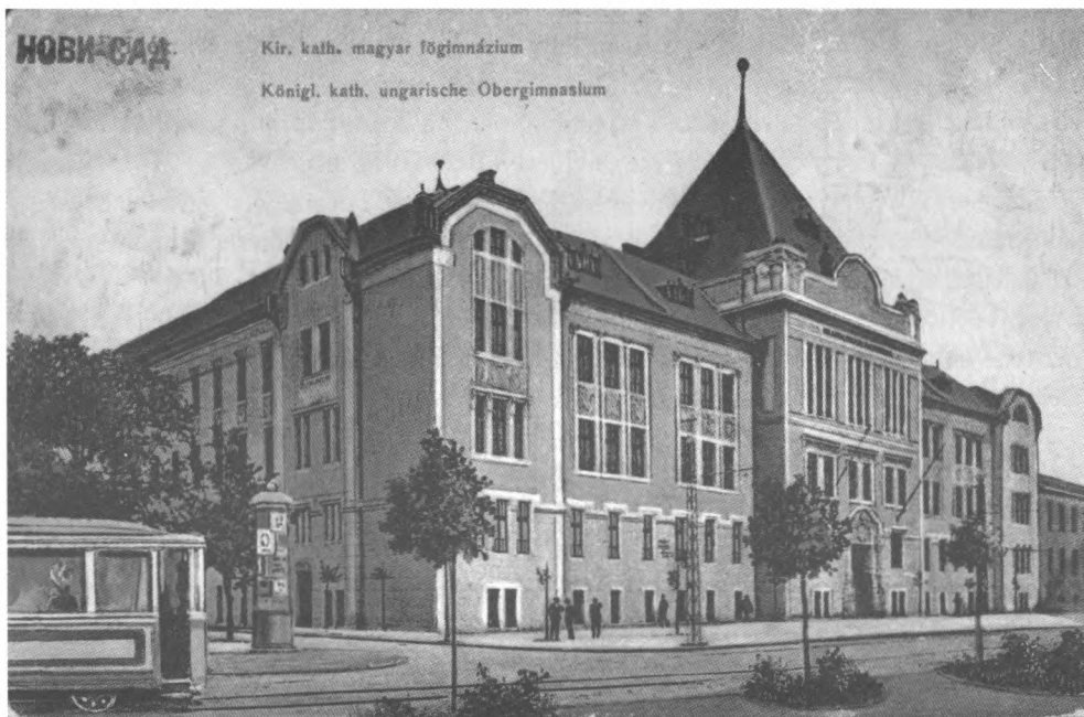
Magyar királyi katolikus felső gimnázium épülete, régi képeslapon.