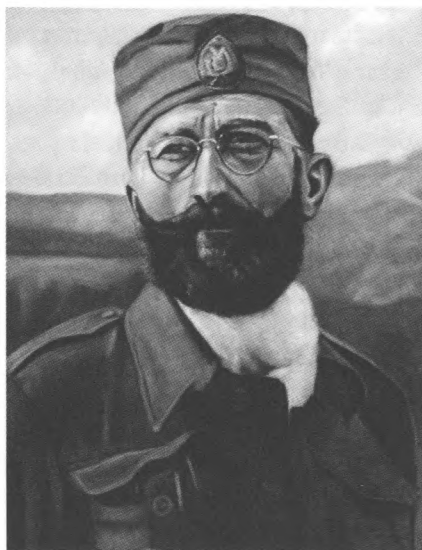
Draža Mihajlović