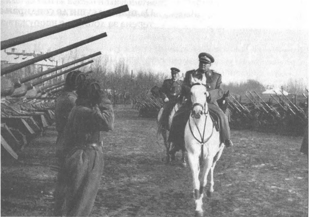
Tito fehér lovon