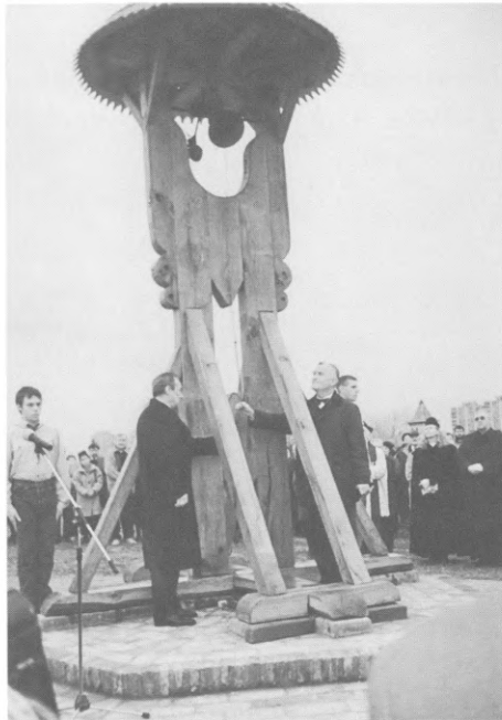
Első kongatás 2002. november 2-án a harangláb megszentelésénél

Ezt követi a kongatás a haranglábnál: mindig egy áldozat hozzátartozója kondítja meg a megemlékezés harangját. Ekkor a cserkészek zászlóikkal tisztelegnek, a jelenlévő magyar honvédség tisztje pedig tisztelgésre lendíti karját – mi pedig hozzátartozók és megemlékezők összekulcsolt kézzel imádkozunk szeretteinkért!