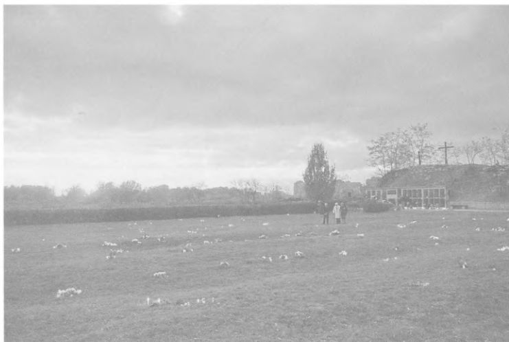
A nap leszállóban, alkonyodik, de a mécsesek égnek ...

Ekkor helyezik el a hozzátartozók és a megemlékezők saját virágait, gyertyáit és mécseseit és akkor már az alkonyatban valóban a lélek csendje, az ajakak imája szál az ég felé, és a mécsesek pislogó fénye tekint fel az égre.