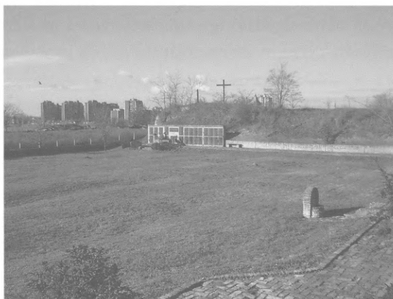
Az emlékfalról a névtáblákkal madártávlatból