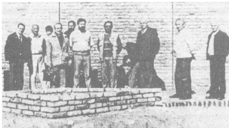
1994 októbere, az emlékbizottság megtekinti a helyszínen a munkálatokat. Itt már látható az elkészült emlékfal

Mérete és hangneme miatt, sajnos, nem lehet megkerülni azt, hogy augusztusban és szeptemberben a kommemoráció körül – a szoboravatás ürügyén – egyoldalú, ám mégis zajos „csatározás” alakult ki, amelynek folyamán aláírt és aláíratlan cikkekben és közlemények útján, különféle érvekkel, történelmi tények elferdítésével, sőt uszító kijelentésekkel és fenyegetésekkel kíséreltek meg egyesek ellenséges hangulatot kelteni, amivel a magyarság megfélemlítését akarták elérni. Meg kell említeni azt is, hogy ugyanezek egymás után tartottak hivatalos kommemorációkat, és egy szobrot is felavattak ugyanolyan adminisztratív feltételekkel, amelyek alapján az áldozatok emlékére szánt szobor ellen hajsza indult. Egyes írásokban olyan megfogalmazásokat lehet találni, amelyeknek szerzője mintha elfelejtette volna, hogy mit tett közzé 1991-ben Đilasról szóló könyvében Vladimir Dedijer: „... mi moramo da se osvrnemo šta smo i mi radili na kraju rata. Jednom sam zajedno sa drugom Titom i Rankovićem računao kakva je bila osveta naše revolucije za nevino pobijene ljude, za popaljena sela. Mi smo poslednje godine rata, kao i prvih nekoliko meseci posle pobeđe streljali oko 150 hiljada ljudi.” (Vladimir Dedijer: Veliki buntovnik Milovan Đilas. Prosveta; Beograd, 1991. 64. old.)