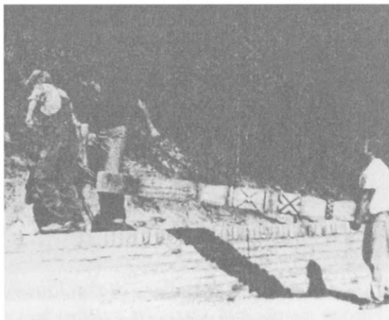
A nagy kereszt és a kopjafa megindul a mai helyére

Az 1993-ban az agyaggödör közepében felállított keményfából készült hatalmas kereszt és kopjafa, még két kis kereszttel és egy kis kopjafával felkerült az emlékfal mögötti domb tetejére.