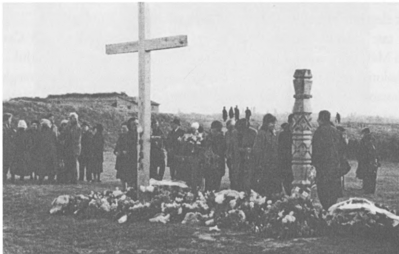
1993. november 2. Most már áll a nagy kereszt és a kopjafa is