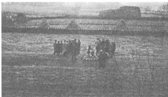
Ekkor már kicsit többen voltunk. 78