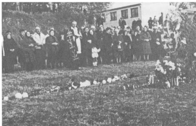
Mind többen vagyunk!