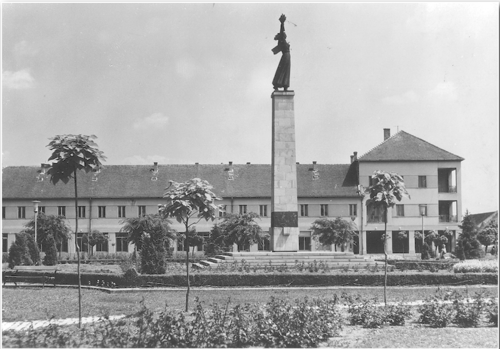
Szenttamási újjáépítés. Az 1944–1945-ös „tisztoztatások” után, a községháza és a szerb templom közötti üzleti negyed lebontását követően az új rendszer fölépítette saját Szabadság-szobrát, s háttérében a lebontott csendőrlaktanya helyén az új Szövetkezeti Otthont

Az impériumváltás első fél évében vállalt szerepük és tevékenységük miatt az előző névsorokban említett, jóval több mint száz helybéli szerb személy szinte egytől egyig ártatlan polgári lakosság ellen elkövetett súlyos háborús bűnökért lett volna felelős, ha a bolsevista és posztkommunista rendszer nem csinált volna belőlük saját létének igazolására is nemzeti hősokeket.