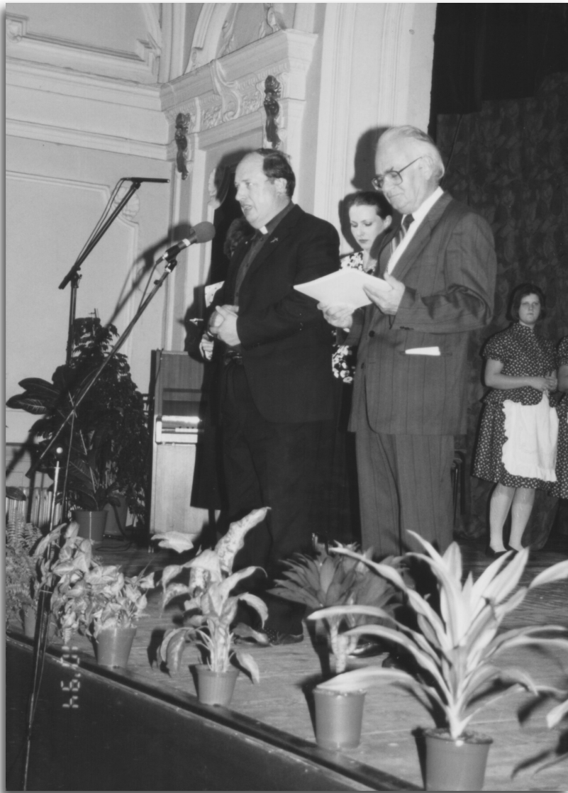
Ft. Nagy József ünnepi beszéde a zentai színházteremben 1994. október 2-án