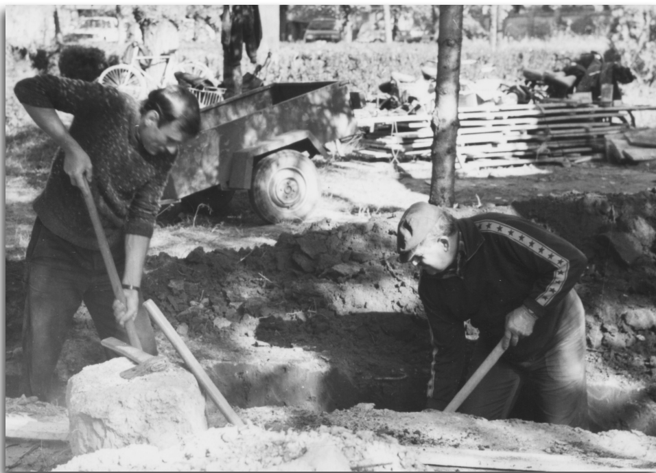
Önkéntesek a kápolna alapját ássák 1992 őszén