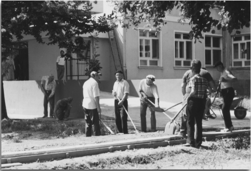
A kápolnához vezető járda betonozása 1994 nyarán