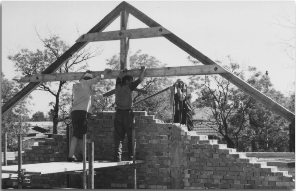
A tetőszerkezet állítása 1993 nyarán