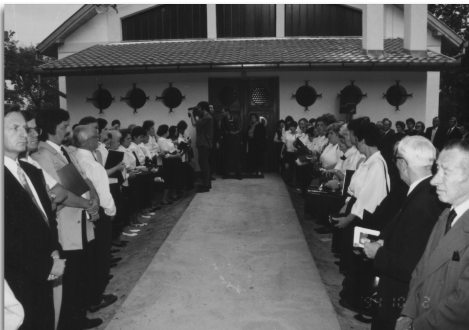
A hívők sorfala a kápolnához vezető járda mentén 1994. október 2-án