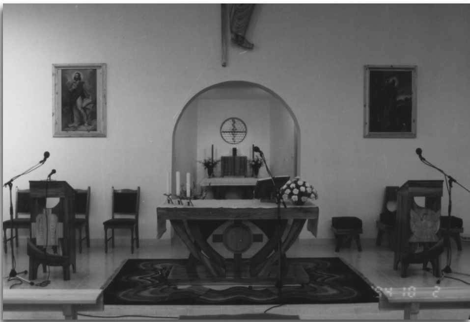
A kápolna liturgikus tere