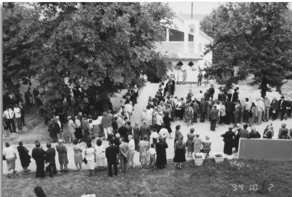
A kápolna felszenteléséhez készülődnek a hívek 1994. október 2-án