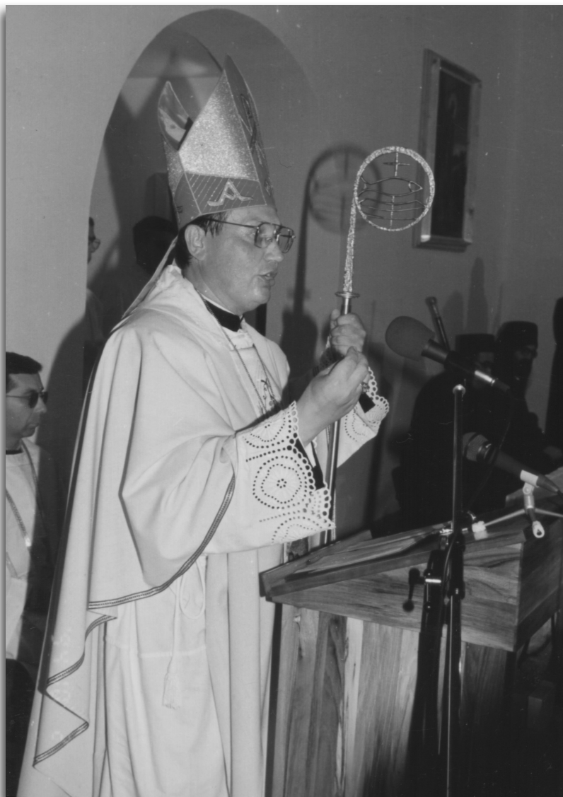
Msgr. Péntes János püspök szentbeszédet mond 1992. október 2-án