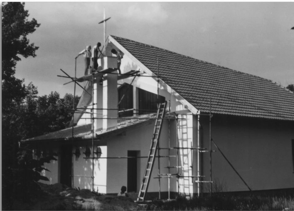
A harang felszerelése 1994 nyarán