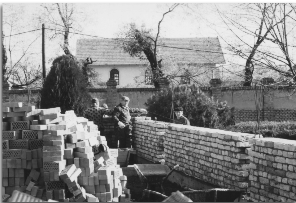
A kápolna falazása 1992 novemberében