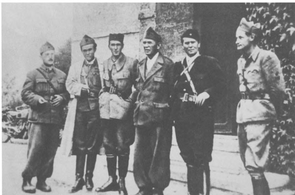
Titó (jobbról a második) partizánok egy csoportjával