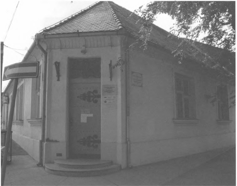
Az egykori rendőrség épülete a Petőfi Sándor utcában, ahol 1944 sok magyart tartottak fogva (Szabadka)