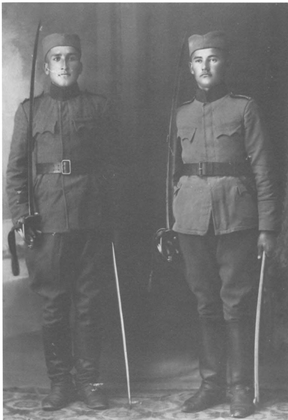
A seregben (bal oldalon)