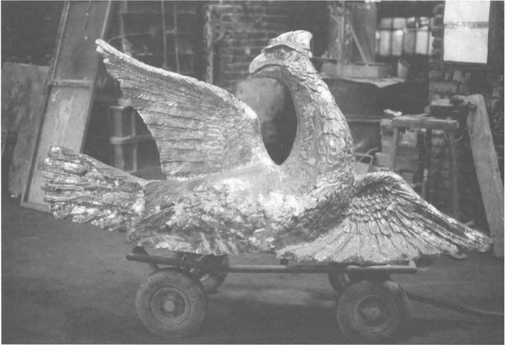
Kalmár Ferenc bronzba öntött madara a helyszínre szállítás előtt (1994)