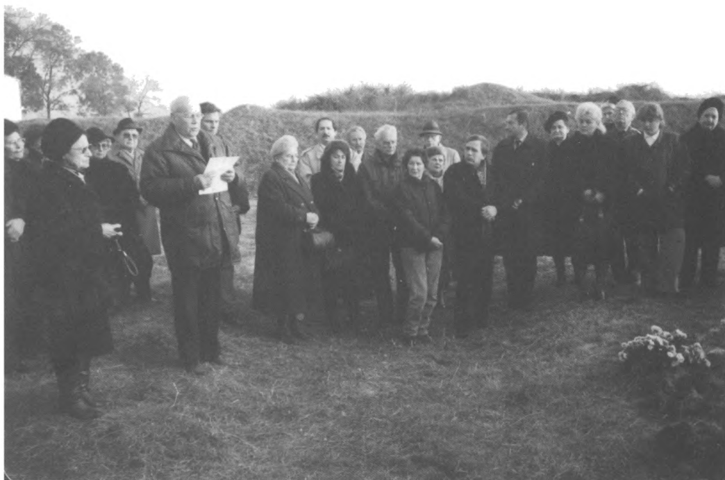
Az 1991-es második megemlékezésen már több mint kétszázan voltak jelen (Szabadka)