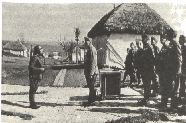
Szombathelyi Ferenc látogatása a fronton, 1942. szeptember

Jobbról balra: Szombathelyi Ferenc, Aykler Domokos alezredes, Ujszászy István vezérőrnagy, Kádár Gyula vk. ezredes