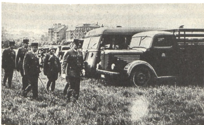
A Honvéd Vezérkar főnöke elvonul a harctérre induló haditudósító csapatok előtt, 1942