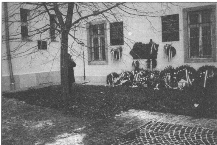
Szombathelyi Ferenc vezérezredes, Jány Gusztáv vezérezredes és a Don menti harcok áldozatainak emléktáblája a budapesti Hadtörténeti Intézet és Múzeum udvarán