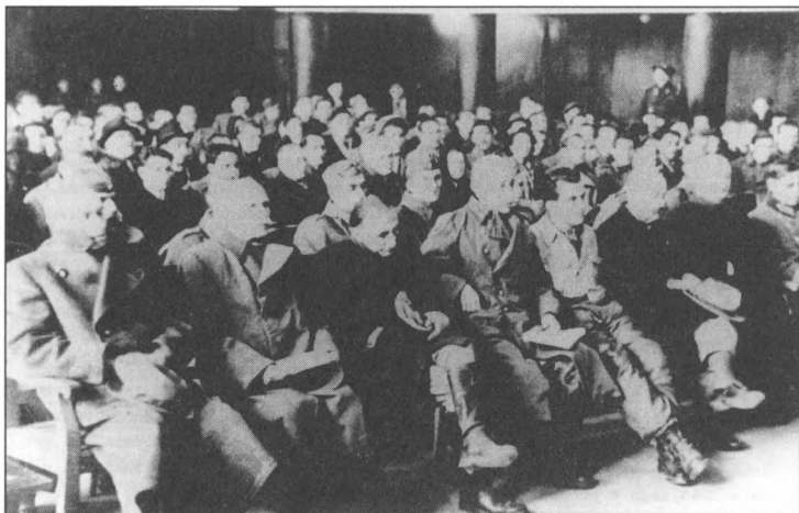
A péterváradi kultúrház mozitermében, 1946. október 30. Az első sorban a vádlottak