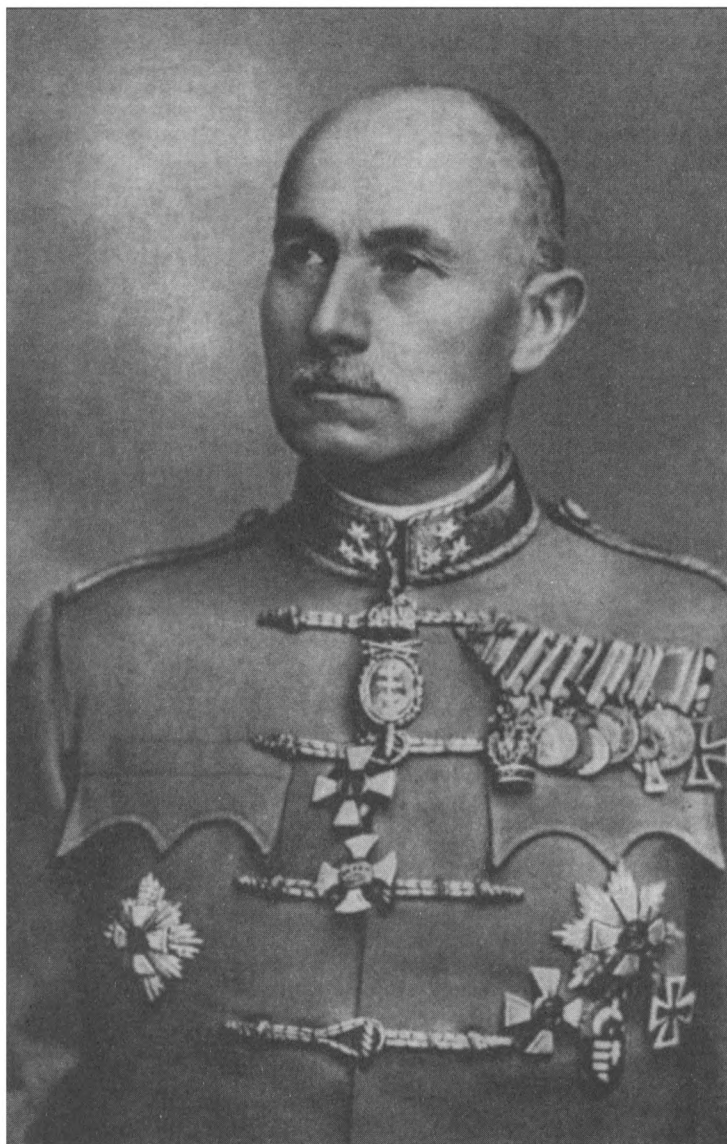
Szombathelyi Ferenc vezérezredes, a honvéd vezérkar főnöke, 1941. november