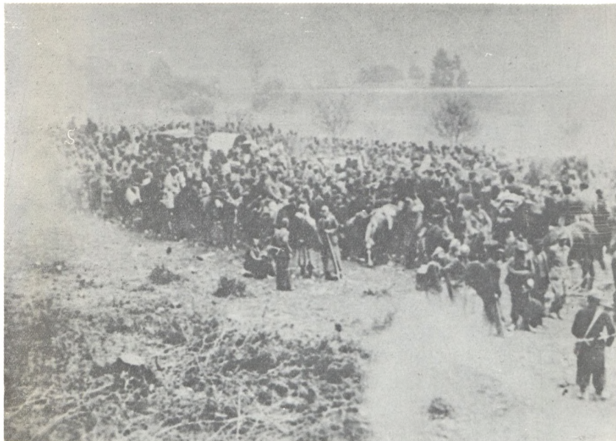
Pripadnici 104. nemačke divizije, koje je 7. vojvođanska brigada zarobila u Sloveniji, maja 1945. godine