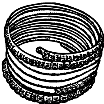
Dák ezüst karperec. Kovin

kapott menedéket, és azok így megerősödvé hatalmukat kiterjesztették a Bánátra is. Ezt számos korabeli sír és lelet bizonyítja, tisztázva egyúttal azt a sokat vitatott kérdést is, hogy a rómaiak Dáciával együtt bekebelezték-e a szomszédos területeket is. A legnyugatibb dáciai erősség a Déli-Kárpátok lábánál az volt, amely Banatska Palanka alatt a Duna egy szigetén állt, a későbbi Harám. Még két alkalommal szaporodtak az itt élő szarmaták nagyobb számú bevándorlóval, és egészen a IV. század közepéig megtartották függetlenségüket a római limes tőszomszédságában.