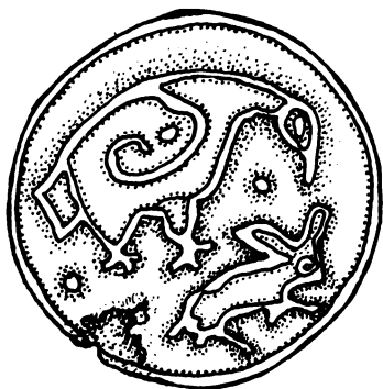
Szarmata korongos fibula zománcdíszítésű vadászjelenettel: a sólyom lecsap a nyúlra. Hódság

magas töltésről – így szól a tudósítás – katonáinak beszédet mondott. Ez az első írott adat a nem éppen találóan „római sáncoknak” nevezett monumentális földművekről. A Vajdaságban levő három sánc közül csak a legrövidebbet, az Újvidék és Bácsföldvár között húzódót tekinthetjük biztosan római eredetűnek. A minket most érdeklő másik sáncrendszer, a Kis római sánc Apatintól indul,