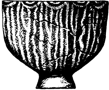
Finom, piros alaptónusú, fehérrel festett agyagcsésze. Starčevo

Vajdaságban a legjelentősebb két Körös-telep Nosza és Ludas mellett található, az egyik a Gyöngyparton, a másik pedig a Budzsákban. Mindkettő a Ludas-tó partján van, de Budzsák fekvése kedvezőbb, mert egy kisebb félszigeten fog-