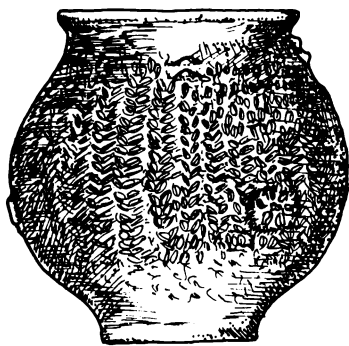
Nagy, csipkedéssel díszített agyagedény. Ludas-Budzsák

Az edények talpán rendszerint egyenletes kopások láthatók, amelyek a házak