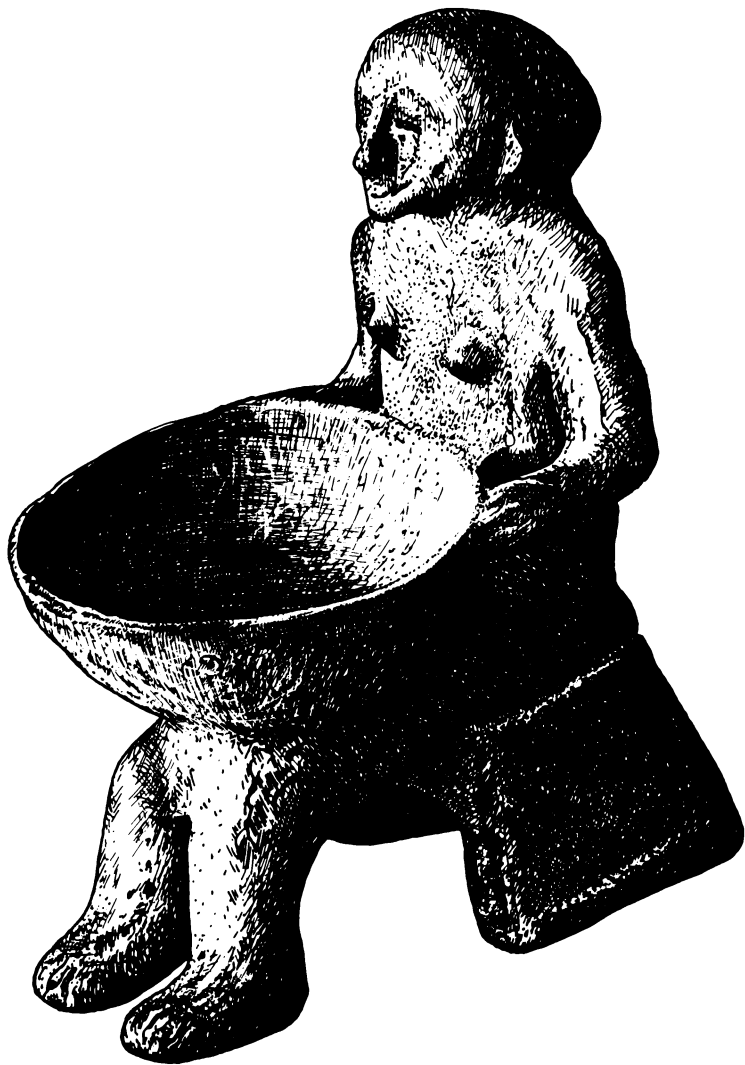
Edényt tartó ülő nő agyagszobrocskája – a termékenység istennője. Törökbecse