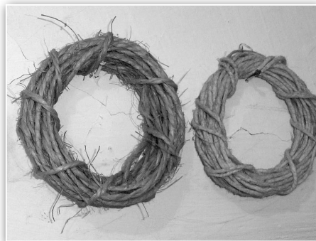
A dohánylevelek felfűzésénél használt madzagtekercek