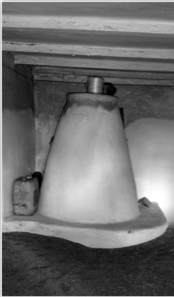
Banyakemence a nagyszobában, az utcára néző első helyiségben

A háznak egy bejárata volt a konyhán, ahonnan az ajtók nyíltak a többi helyiségbe. Az első szoba ajtajától jobbra állt a konyhából fűthető banyakemence, körülötte a padka, az utcára néző ablakok mellett balról és jobbról egy-egy ágy, fölöttük szentképek függtek, középütt asztal négy székkal, az oldalablak mellett tükör, a szobaajtó mögött a kaszni vagy szekrény foglalt helyet.