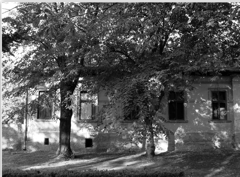
Az óvoda épülete