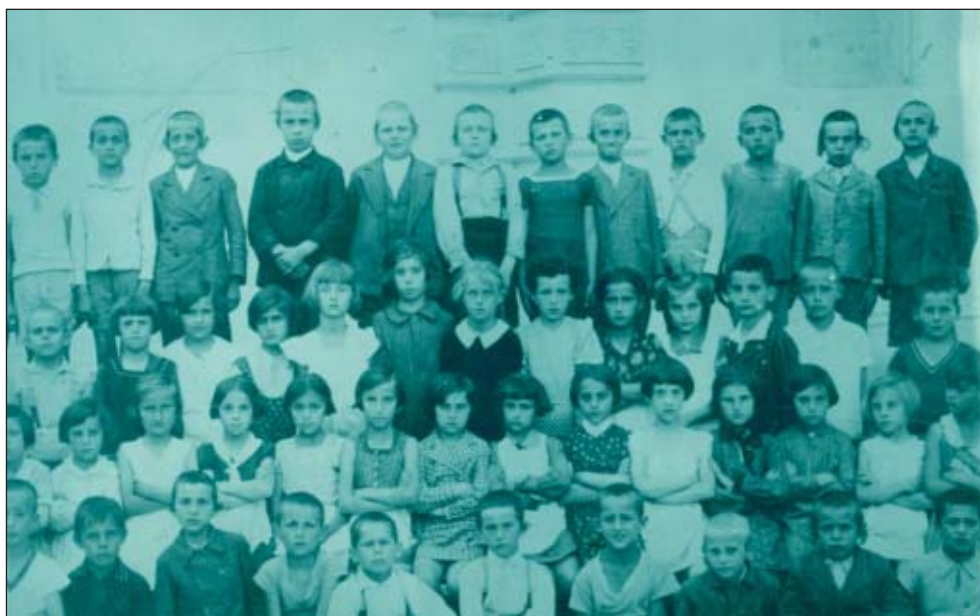
89. Egy másik osztály, 1930-as évek