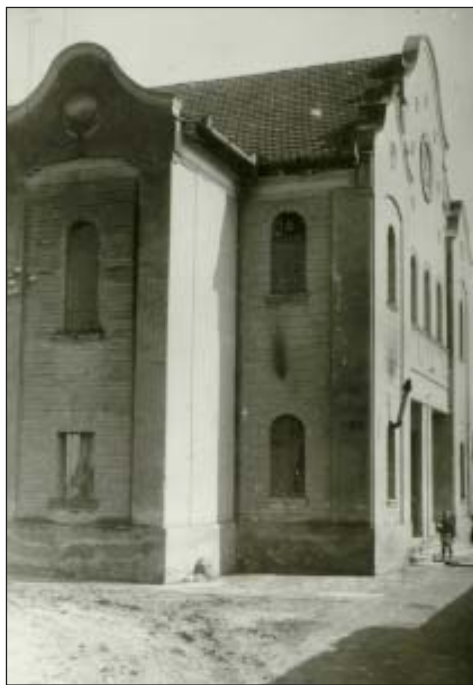
90. Az ortodox szefárd imaház