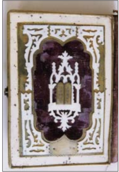
46. Díszes fedelű imakönyvek