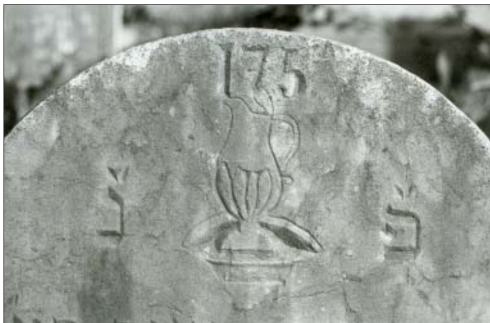
61. Levita kancsó