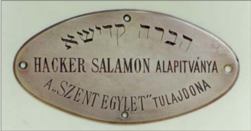
49. A Hevrá kádísá számára váltott zsinagógi ülés réztáblája