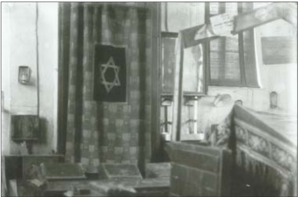
44. Az imaház belülről