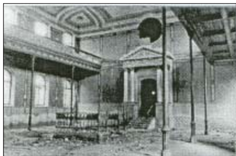
40. A zsinagóga belseje