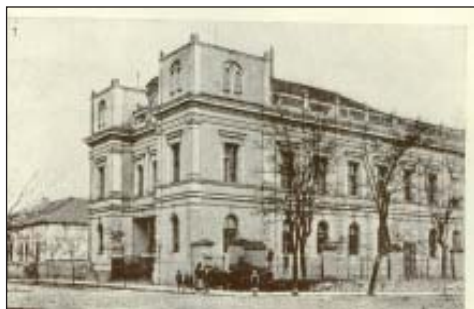
39. A nagy zsinagóga a 20. század első éveiben