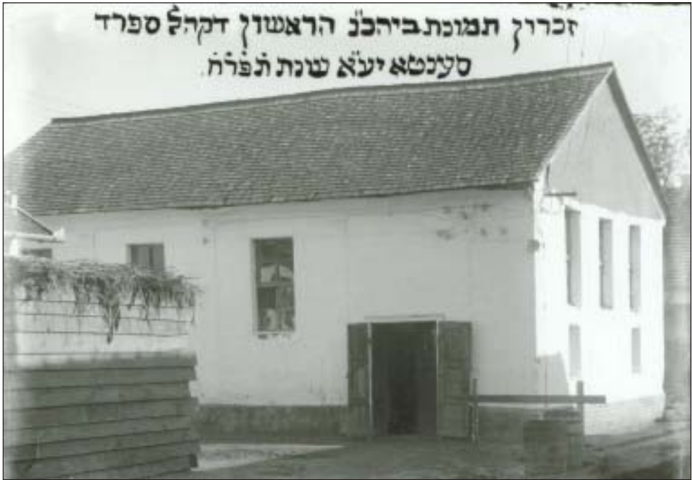
43. A szefárd hitközség első imaháza