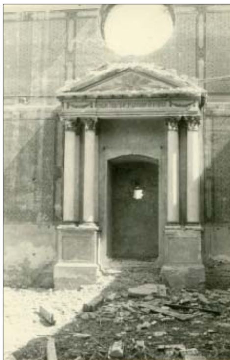
42. A tórafülke