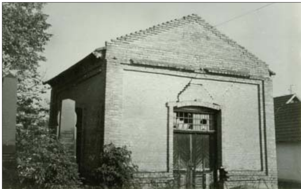
59. A halottsház