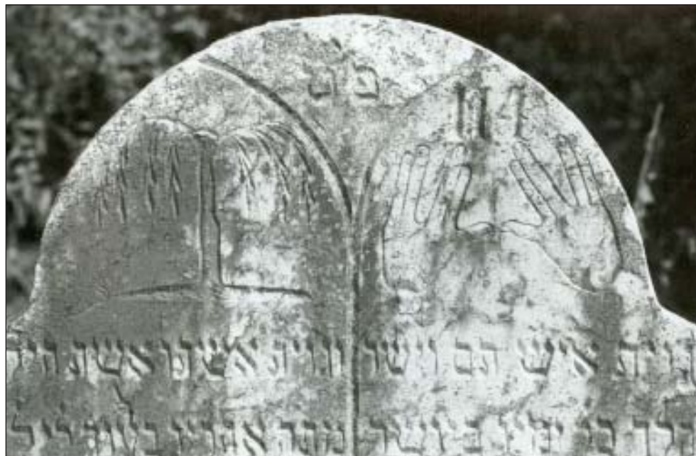
60. Szomorúfűz és kohanita kéz