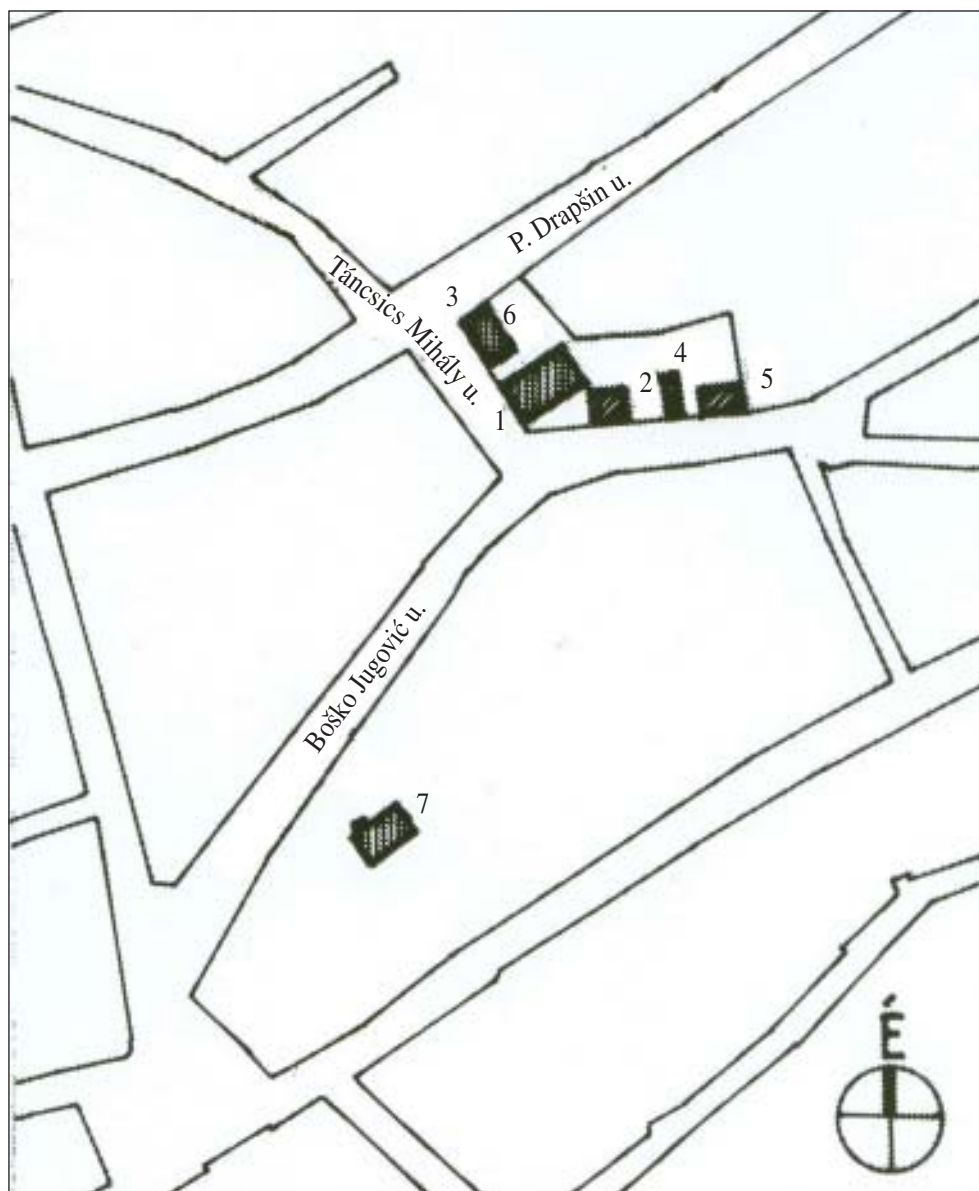
45. A nagy zsinagógai komplexum